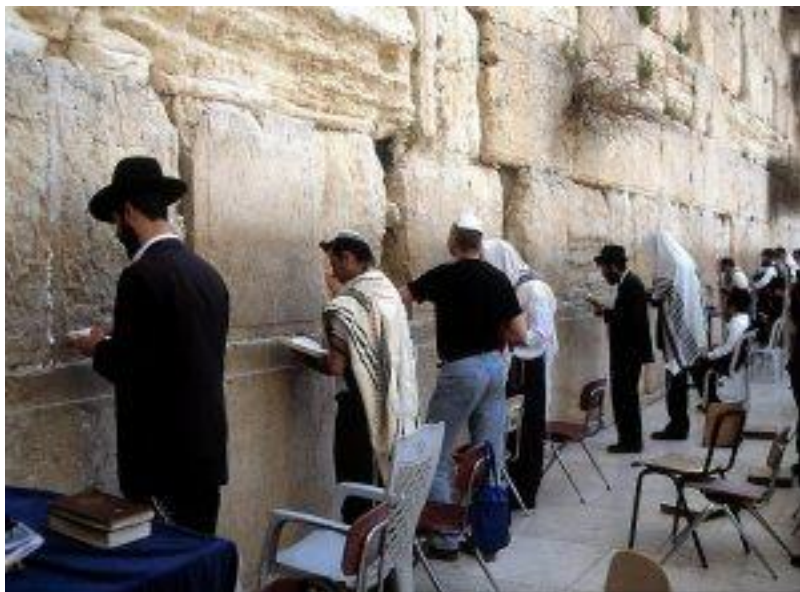
Ściana Placzu w Jerozolimie – pozostałość po Świątyni Jerozolimskiej

Religijnym centrum starożytnego Izraela była Świątynia Jerozolimska – uświęcone miejsce, gdzie składano Bogu ofiary. Pierwszą świątynię (tempel) wznosił król Salomon w połowie X wieku p.n.e., lecz zburzyli ją Babilończycy w 587 p.n.e, którzy to podbili Izrael. Po wyzwoleniu z niewoli babilońskiej odbudowano świątynię na nowo. Przetrwała ona do roku 70 n.e., kiedy to zrównali ją z ziemią Rzymianie. Świątyni nie odbudowano, a do dziś zachował się jedynie zachodni mur budowli zwany Ścianą Placzu (Klagemuren) .