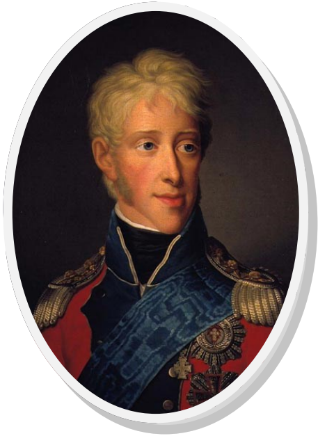
فریدریک ششم پادشاه دانمارک - نروژ بود

در نروژ روز ملی را در ۱۷ مه جشن می‌گیریم. چرا ما درست در چنین روزی جشن می‌گیریم و به چه دلیل؟