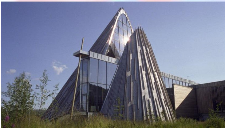
مجلس ملی سامی ها Sametinget

مجلس ملی سامی ها Sametinget استفاده از پرچم ملی سامی ها را تصویب کردند.