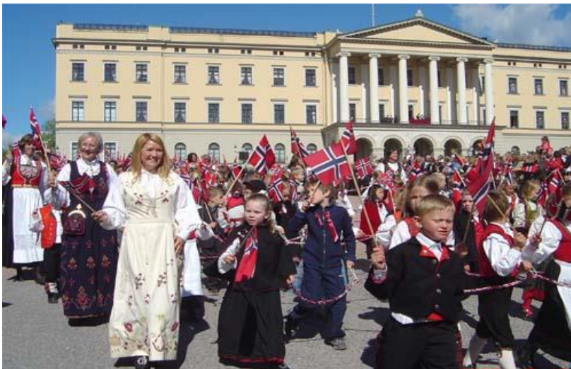
Barnetoget i Oslo foran slottet. Kan du se kongefamilien på balkongen?