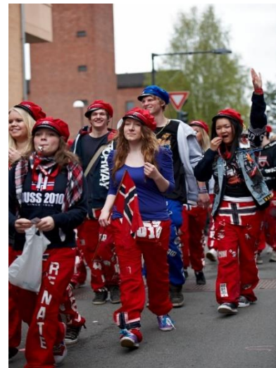
Blåruss og rødruss