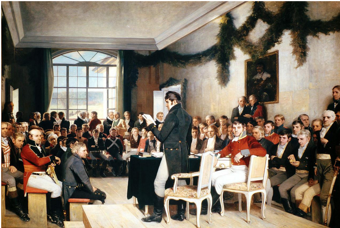
Maleriet heter Eidsvold 1814 og er malt av Oscar Wergeland.

Sannadkii 1814 waxaa ku kulmay Eidsvoll 112 nin si ay u qoraan dastuurka Norway. Waxa ay ka kale yimaadeen meelo kala duwan oo Norway ah . Kooxdan oo ay la jiraan dhammaan raggii waxaa loogu yeeray golaha boqortooyada, waxayna isticmaaleen todobo usbuuc si ay u qoraan dastuurka. 17-kii Maajo ayaa la dhameeyey dastuurka, waxaana saxiixay boqor Christian Fredrik, sidaa darteed waa maalintan tan lagu magacaabo maalinta qaranka Norway.