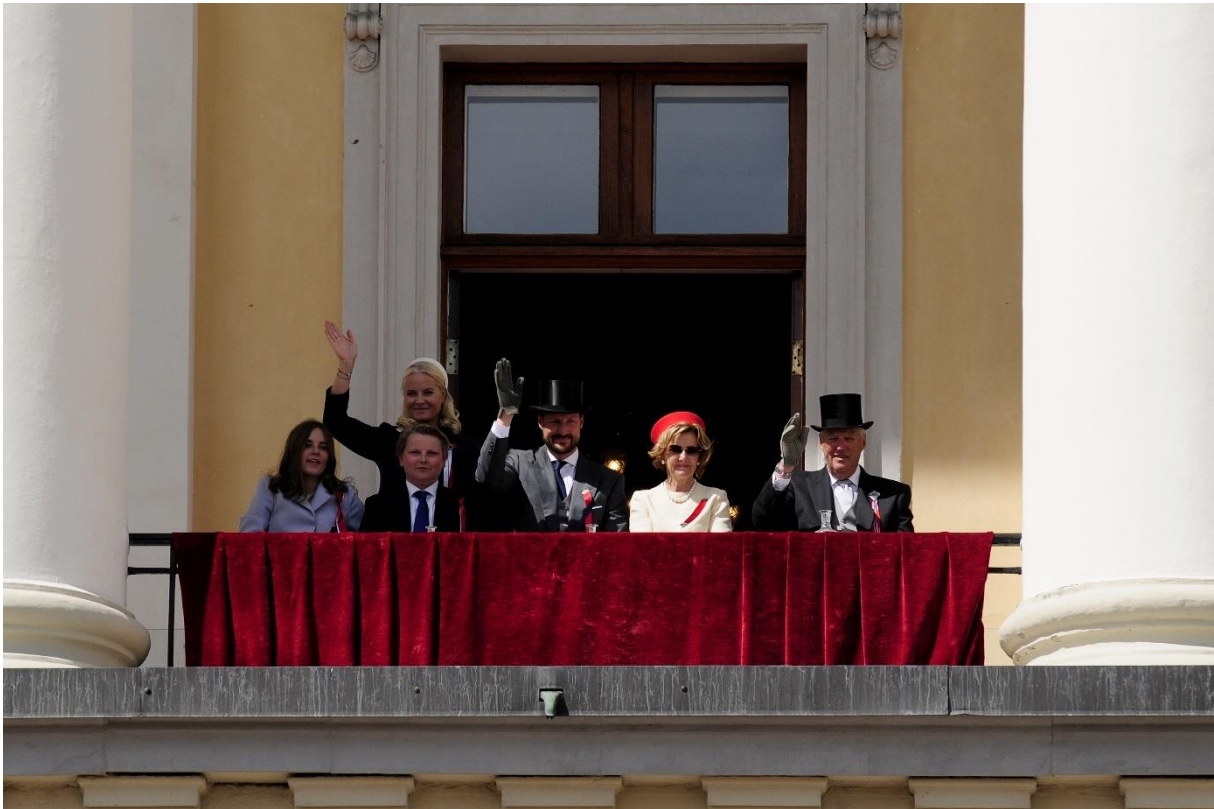
Kongefamilien vinker til barnetoget i Oslo. Fra venstre: prinsesse Ingrid Alexandra, prins Sverre Magnus, kronprinsesse Mette Marit, kronprins Haakon, dronning Sonja og kong Harald