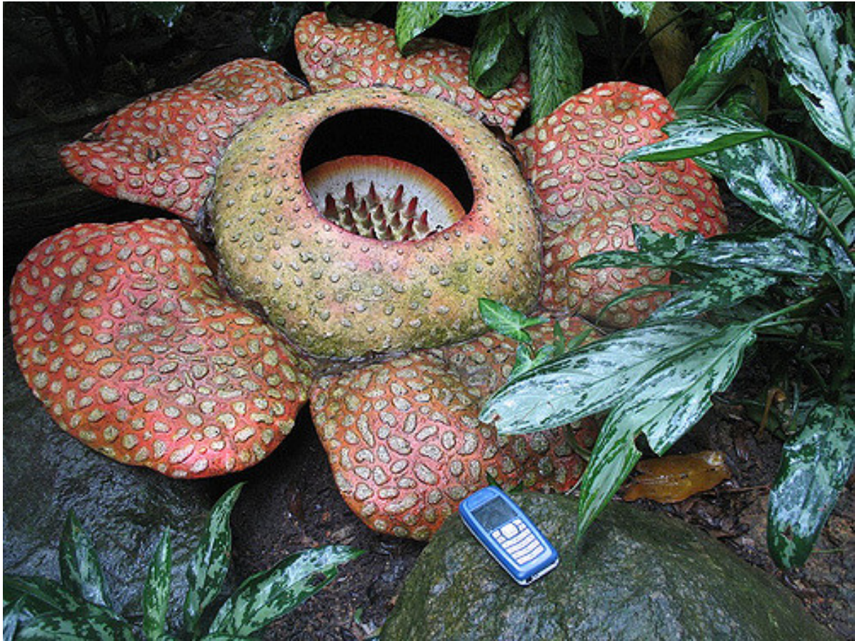
Rafflesia arnoldii , Foto; Antoine Hubert, Flickr

هل شاهدت زهورا صغيرة جدا، ما إسمها بالانجليزي أو بالعربي؟