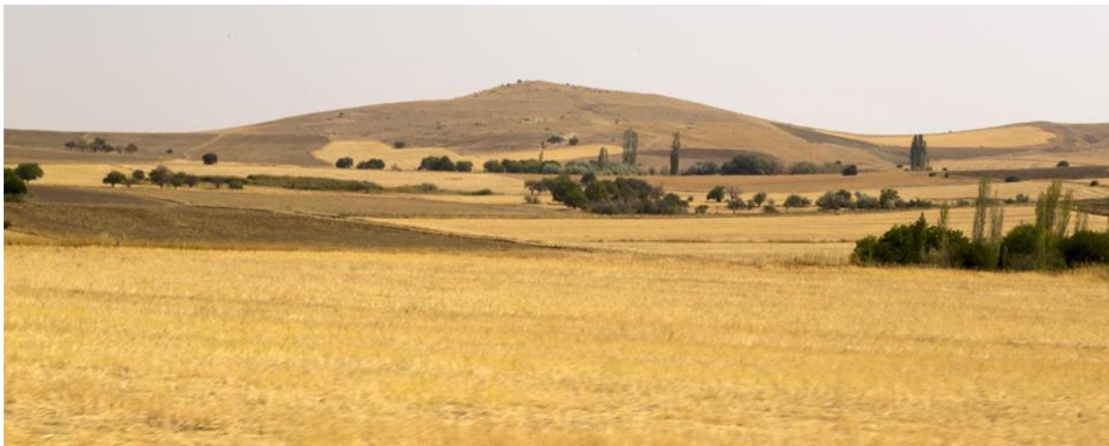
ጎልጎል ቅርጺ መሬት ኣብ ቱርኪ.

ምድረ ሳዕሪ (ጎልጎል) አግራብ ደይብሉ ክፉት ወይ ሰጣሕ ቦታ ኢዩ። ኣብ ሙብዛሕታኡ ጎላጉል ደሎ ሓመድ ብጣዕሚ ሰቡሕ ኢዩ። ስለዚ ከኣ እቶም ጎልጎል ቅርጺ መሬት ደለዎም ሰፋሕቲ ቦታታት ናይ ዓለም ንሕርሻ ንጥቀመሎም ። ሙብዛሕትኡ ጎላጉል ኣብ ማእከላይ ሙቕት ደለዎ ስፍራታት ኤስያን ሰሜንን ደቡብን ኣመሪካን ይርከብ።