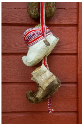
ชัคเคอร์(skaller)รองเท้าจากหนังและขนกวางเรนเดียร์

ในวันที่ 6 กุมภาพันธ์ ชาวซามีจะพูดคำว่า Lihku beivvien! (ลือคู้ ไบวีอิน!) ซึ่งแปลว่า สุขสันต์วันชาติ!