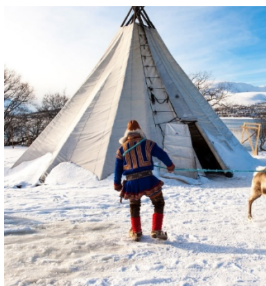
ผู้ชายที่สวมใส่ชุดซามี(samekofte) เขากำลังจับกวางเรนเดียร์ด้วยบ่วงจับสัตว์(lasso) ภาพด้านหลังคือ เต็นท์ของชาวซามี(lavvo)