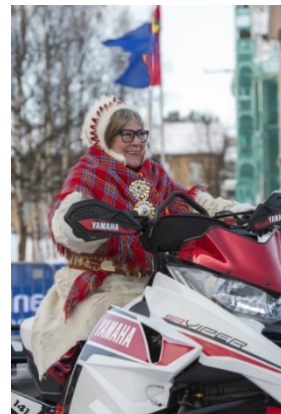
ผู้หญิงที่สวมใส่ชุดซามีที่ท่ามาจากขนกวางเรนเดียร์(pesk) เธอกำลังขับสกูเตอร์