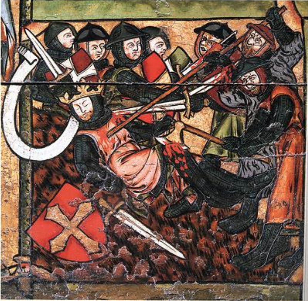
أولاف هارالدسون قتل في معركة ستيكلستاد

خاض رجال أولاف المعركة بشجاعة ولكن في نهاية المطاف اضطروا إلى التراجع أن يتخلى عنها. ضرب أحد الأعداء الملك وأصابه بفأسه في فخذه. بعدها إنهالت الرماح على الملك، وأصابته في بطنه. وبعد أن طعن بالسيف في حلقه توفي.