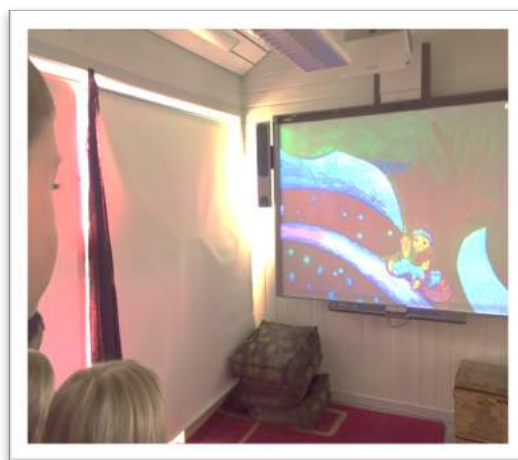
Ranheim barnehage lytter til fortellingen om hatteselgeren.