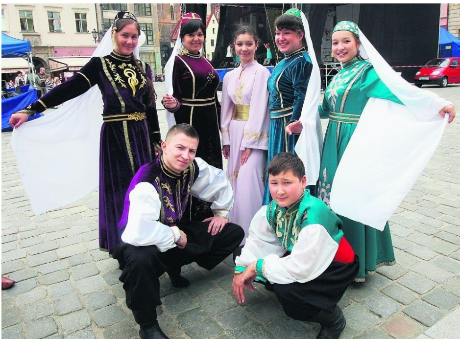
Tatarzy w tradycyjnych strojach

Muzułmanie w Polsce pojawili się ponad 600 lat temu. Są to potomkowie Tatarów , którzy przywędrowali na ziemie Litwy, Polski i Białorusi z nieistniejącego już, potężnego państwa Złotej Ordy. Obecnie mieszka w Polsce około 5 000 Tatarów, głównie na Podlasiu. Mówią w języku polskim, lecz kultywują własne tradycje i zachowali poczucie odrębności religijnej. Polscy Tatarzy mają 3 meczety: w Bohonikach, Kruszynianach oraz Gdańsku.