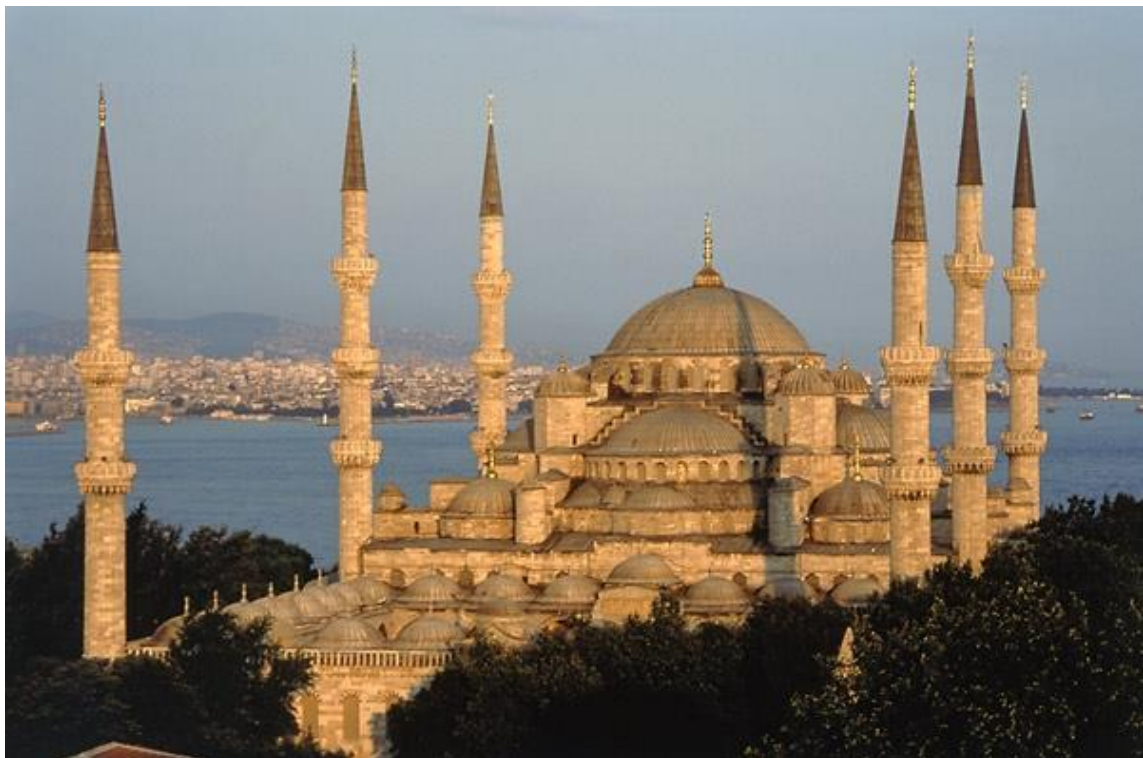
Meczet w Istambule (Turcja)