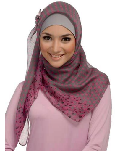
Muzułmanka w hidżabie

Muzułmanin ma być dobry dla innych ludzi, szczodry i gościnny. Nie powinien być kłótniwy ani obmawiać innych. Wyznawca islamu powinien tylko jeść pożywienie dozwolone (tillatt) przez Koran, czyli halal . Zakazane jest na przykład spożywanie wieprzowiny (svinekjøtt) i należy unikać alkoholu. Nie wszyscy muzułmanie stosują się jednak do zakazu picia alkoholu. Nie powinno się także pokazywać nago innym, także osobom tej samej płci. Mężczyźni mają zakrywać ciało od pasa w dół, a kobiety całe ciało. Wiele muzułmanek nosi także nakrycie głowy (hodeplagg) zwane hidżabem . Nie wszyscy jednak wyznawcy islamu przestrzegają reguł dotyczących ubioru. Piątek jest dniem świętym dla muzułmanów i w ten dzień wielu z nich modli się w meczecie (moské) , czyli muzułmańskim domu modlitwy.