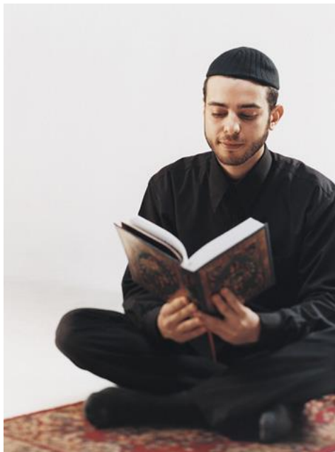
Muzułmanin czytający Koran

Zanim muzułmanin weźmie do ręki Koran musi on umyć ręce aż po łokcie i stopy po kostki. Święta księga powinna leżeć na innych książkach, a czytając ją należy trzymać ją na wysokości serca.