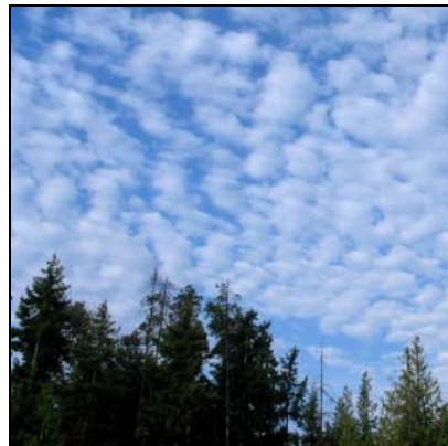
المزن الركامية أو الركام المزني