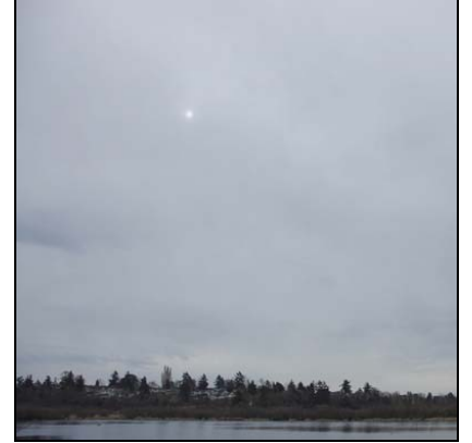
السحاب الطباقى المتوسط