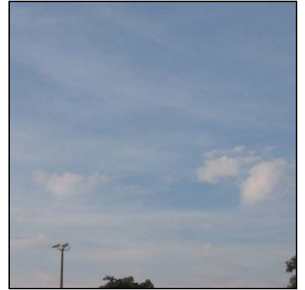
السحاب الطباقى المرتفع