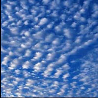
السحاب الركامي المتوسط