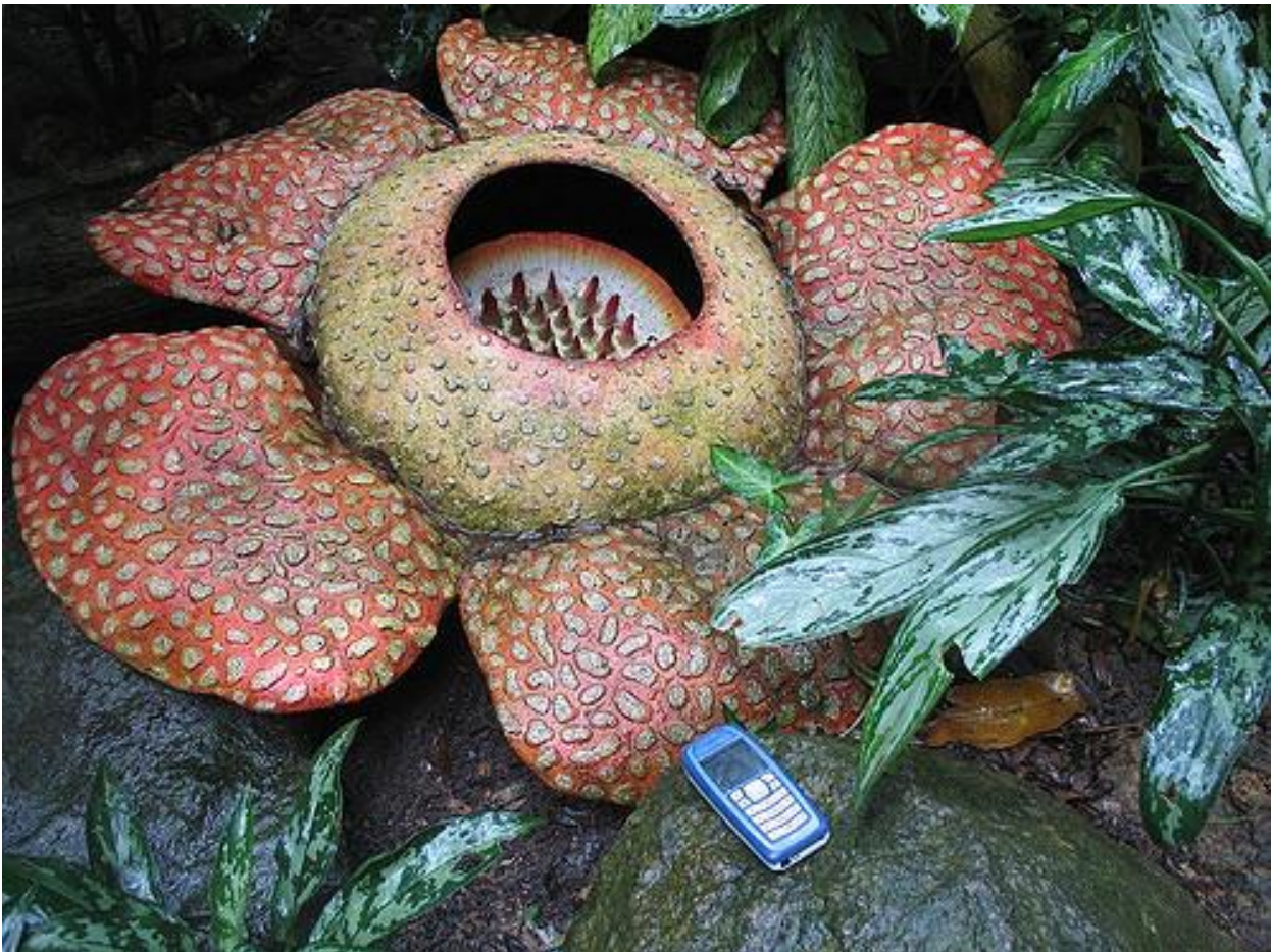
Rafflesia arnoldii

گه وره ترین گوئی جیهان ناوی (رافیسیا ئالمۆدی)یه. ئەم گوئه تیره که ی ده توانیت یه ک مه تربیت و له و لاتی ئەندونیسیا گه وره ده بیت. گوئه بچووکه کان تیره که یان ده گاته چه ند میلیمه تریک. گوئی زۆر بچووکت بینوه؟ به نه رویجی یان به زمانی کوردی چی پێ ده ئین؟