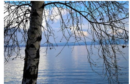
Bjørk om vinteren

گه لا داره گه وره کان، گه لا کانیاں له پایزدا ده وه ریت چونکه پیوستان به ئاوه، له زستاندا ئاو له ناو زه ویدا ده گاته پله ی به سن و ده بپت به سه هۆل. کاتیک دره خته کان گه لایان نییه رووه کان پیوستان به ئاو نییه. به م شیویه هه تا ئه و کاته ی که سه هۆلکه ده تویتته وه ده میننه وه. ئه و کاته گه لا و گوئی و تۆو دروست ده کهن.