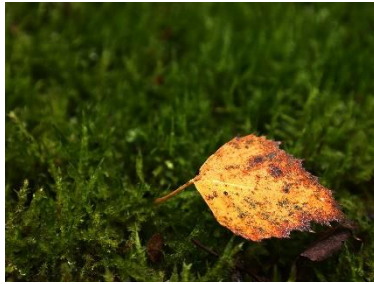
Høstløv fra bjørk