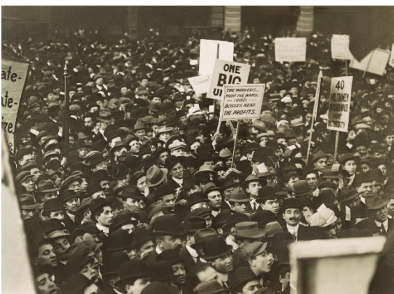
New York 1912.

Vykstant XIX amžiaus pramonės revoliucijai, daugelyje šalių įsisteigė daugybė gamyklų. Produkcija jose buvo gaminama dideliais kiekiais. Žmonės persikėlė į miestus dirbti fabrikuose. Darbo diena buvo daug ilgesnė nei šiandien, o darbo sąlygos - labai prastos. Palaipsniui darbininkai susibūrė į profesines sąjungas kovoti už savo teises.