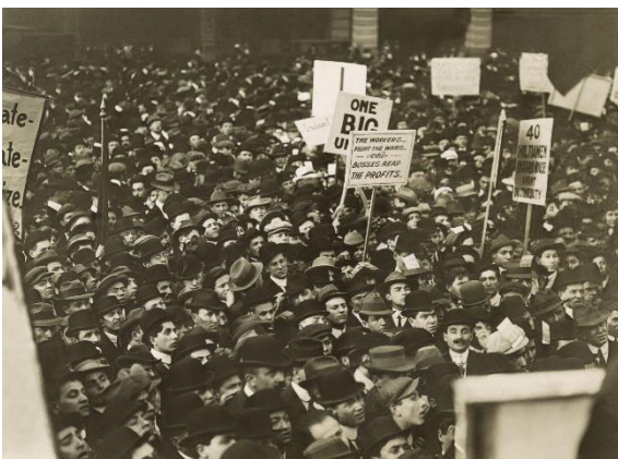
New York 1912.

Som en del av den industrielle revolusjon på 1800 tallet vokste det fram mange fabrikker i mange land. Varer ble produsert i store mengder. Folk flyttet til byene for å jobbe i fabrikkene. En arbeidsdag varte som regel mye lenger enn det vi er vant til, og mange steder var arbeidsforholdene ikke særlig bra. Etter hvert organiserte arbeiderne seg i arbeiderforeninger for å kjempe for sine rettigheter.