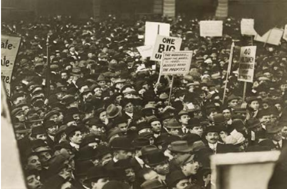
New York 1912.

fabrykach panowały bardzo trudne warunki pracy. Z czasem robotnicy z fabryk zaczęli łączyć się i organizować związki zawodowe, żeby walczyć o swoje prawa.