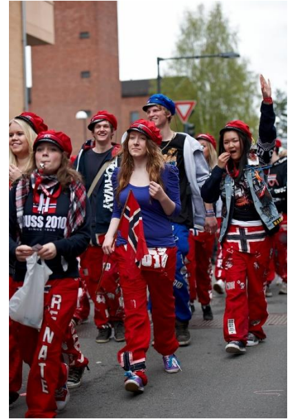
Blåruss og rødruss

17 مايو يسمى أيضا يوم الأطفال. ففي جميع أنحاء البلاد يذهب أطفال المدارس في مسيرات ويلوحون بالأعلام ويهتفون ويغنون. تقوم الفرق الموسيقنة بعزف الأناشيد الحماسية. في هذا اليوم ينشد العديد من الناس النشيد الوطني "نعم ، نحن نحب هذا البلد". النشيد الوطني كتبه الشاعر الشهير بيورنشتارن بيورنسون عام 1859. وفي عام 1863 قام ابن عمه ريكار نوردراك بتلحين النشيد الوطني.