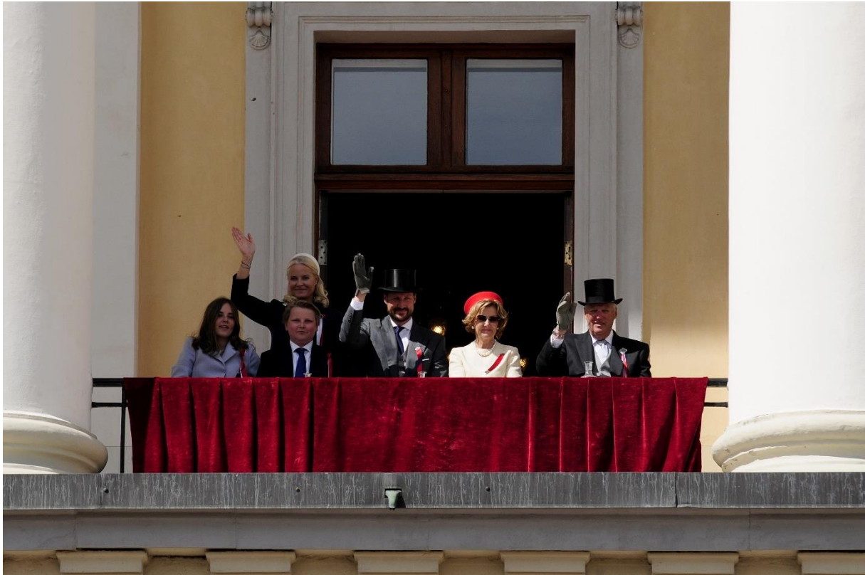
Kongefamilien vinker til barnetoget i Oslo. Fra venstre: prinsesse Ingrid Alexandra, prins Sverre Magnus, kronprinsesse Mette Marit, kronprins Haakon, dronning Sonja og kong Harald

تمر مسيرات الأطفال عبر الشارع الرئيسي في أوسلو والذي يسمى شارع كارل يوهان. تمر المسيرات من أمام القصر الملكي حيث يلوح جميع الأطفال والمعلمين للعائلة الملكية. وتلوح العائلة الملكية لهم كذلك. هناك أكثر من مائة مدرسة تشارك في مسيرات الأطفال في مدينة أوسلو.