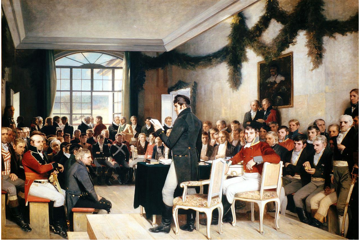
Maleriet heter Eidsvold 1814 og er malt av Oscar Wergeland. Kilde: Wikipedia

يوم 17 مايو ، تم الانتهاء من الدستور ، ووقع عليه الملك كريستيان فريدريك ، ولهذا يسمى هذا اليوم باليوم الوطني للنرويج.