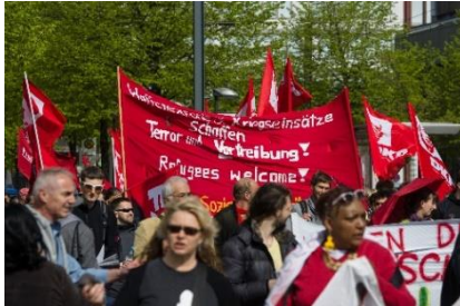
برلین، عکس: سرگی کهول، Shutterstock