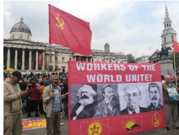
لندن، عکس: لوندیسلند، Shutterstock