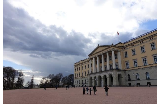
قلعه نروژ (Det norske slottet). عکس: جک ون سکودرهیم (GK von Skodderheim) از Pixabay عکس: جک ون سکودرهیم (GK von Skodderheim) از Pixabay (Ottverik)