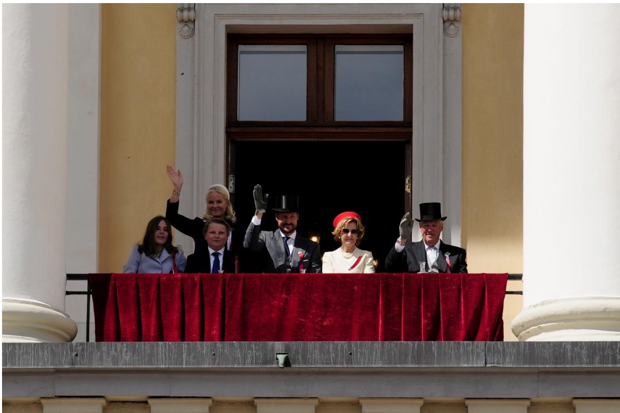
خانواده سلطنتی بسوی موکب کودکان در اسلو دست تکان می دهند. از طرف چپ: شاهدخت اینگری الکساندرا (Ingrid Alexandra) شهزاده سوره ماگنوس (Sverre Magnus)، شاهدخت مرته ماریت (kronprinsesse Mette Marit)، ولیعهد سلطنت شهزاده هوگون (Haakon)، ملکه سونیا (Sonja) و شاه هارالد (Harald)

اسم پادشاه نروژ شاه هراالد و اسم ملکه، ملکه سونیا است. پادشاه، ملکه و بقیه خانواده سلطنتی هر هفدهم ماه مه در بالکن قلعه می ایستند و برای موکب کودکان در اسلو دست تکان می دهند. قطار کودکان از خیابان اصلی اسلو که خیابان کارل یوهانس نام دارد حرکت می کند. این قطار از برابر قلعه عبور می کند و همه کودکان و معلمان برای خانواده سلطنتی دست تکان می دهند. خانواده سلطنتی نیز متقابلاً دست تکان می دهند. بیش از صد مدرسه در راه پیمائی کودکان در اسلو شرکت می کنند.