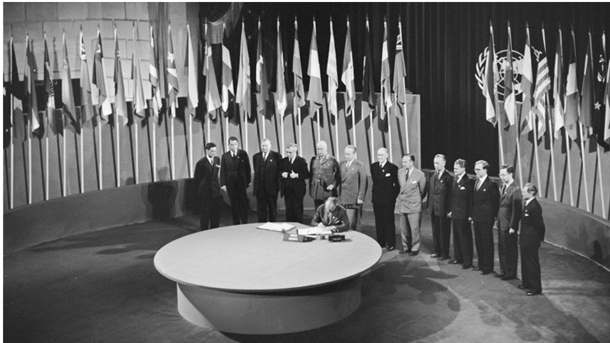
ምፍራም ውዕል ውድብ ሃገራት

ሃገራት ኮይኑ። እቲ "ዩናይትድ ኔሽንስ" ዝብል ኣምር መጀመርያ ዝተጠቐመ ሰብ፡ መራሒ ነበር ናይ ኣሜሪካ ፍ ራንክሊን ሮዬቭልት ብ 1939 ነበረ እዩ። ኣብ እዋን እቲ ኩናት፡ ኣሜሪካ፣ ኣብቲ እዋን እቲ ዝነበረ ሶቪየት ዩኒየንን ዓባይ ብሪጣኒያን፡ ሓደ ሓዲሽ ሰላም ዓለም ዝዕቅብ ውድብ ክምስረት ክምዘድሊ ወሲነን። 1 ጥሪ 1942፡ 26 "ኪዳን ምትእስሳር ዘለዎም " ኢሎም ነብሶም ዝጽውዑ ዝነበሩ ሃገራት፡ ነቲ ውድብ ሕቡራት ሃገራት ተባሂሉ ዝተመስረተ ውድብ ኣፍልጦ ሂቦም። ኣብቲ እዋን እቲ ንመጀመርያ ጊዜ እቲ ውድብ ሕቡራት ሃገራት ዝብል ኣምር ብወግዓዊ ኣብ መዝገብ ሰፊሩ።