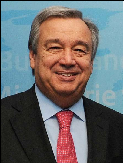
እዚ ሕጂ ዋና ጸሓፊ ውድብ ሕቡራት ሃገራት ኮይኑ ዘገልግል ዘሎ፡ ኣንቶንዮ ጉትረስ