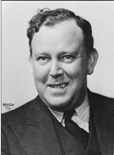
እቲ ናይ መጀመርያ ዋና ጸሓፊ ውድብ ሕቡራት ሃገራት፡ ትሪግሽ ሊ

መዓልታዊ ዕድል ውድብ ሕቡራት ሃገራት ዝምራሕ፡ በቲ ዋና ጸሓፊ ናይዚ ውድብ ዝመርሖ ሰክረታርያት ውድብ ሕቡራት ሃገራት ይኸውን። ዋና ጸሓፊ ናይዚ ውድብ እዚ፡ ኣፈኛን መራሒን ናይ ውድብ ሕቡራት ሃገራት ኮይኑ ይዓዩ። እቲ ናይ መጀመርያ ዋና ጸሓፊ ውድብ ሕቡራት ሃገራት ትሪግሽ ሊ ዝሾሙ ኖርወጂያዊ እዩ ኔሩ። እዚ ሕጂ ዋና ጸሓፊ ውድብ ሕቡራት ሃገራት ኮይኑ ዘገልግል ዘሎ ኣንቶንዮ ጉትረስ ክኸውን ከሎ፡ ቅድሚ ሕጂ ኣብ ፖርቱጋል ቀዳማይ ሚንስቴር ኮይኑ ኣገልጊሉ እዩ።