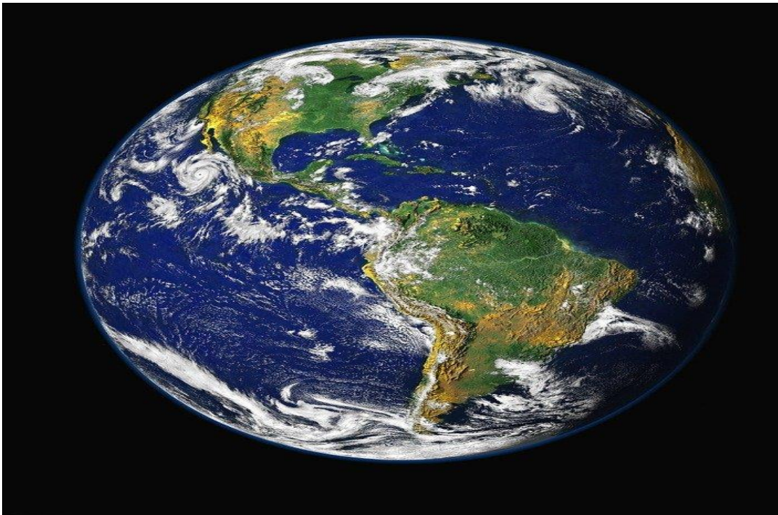
Sawirka 2aa Dhulka.

shintiris-sanadeedka (kalendarka) ka mid ah wuxuu noqdaa 366 malmood, waxaana la yiraahda sanad shindhalad ah ( skuddår ). Sanad walboo 4-aad waa inuu maalindheri ahaadaa, maxaa yeelay dhulka 365 beri in ka badan bay ku qaadata halkii meerwareeg. Haddi aan sidaa la yeelin xooga qalad ahbaa tirsiga galaaya. Saa daraadeed bey sanad shindhalad ah ugu jirin qarni walboo aan u qaybsami karin 400. Tusaale sanadkii 1900 ma ahayn sanad shindhalad ah, haseyeeshe sandakii 2000 wuxuu ahaa shindhalad, waayo waa loo qaybin kara 400.