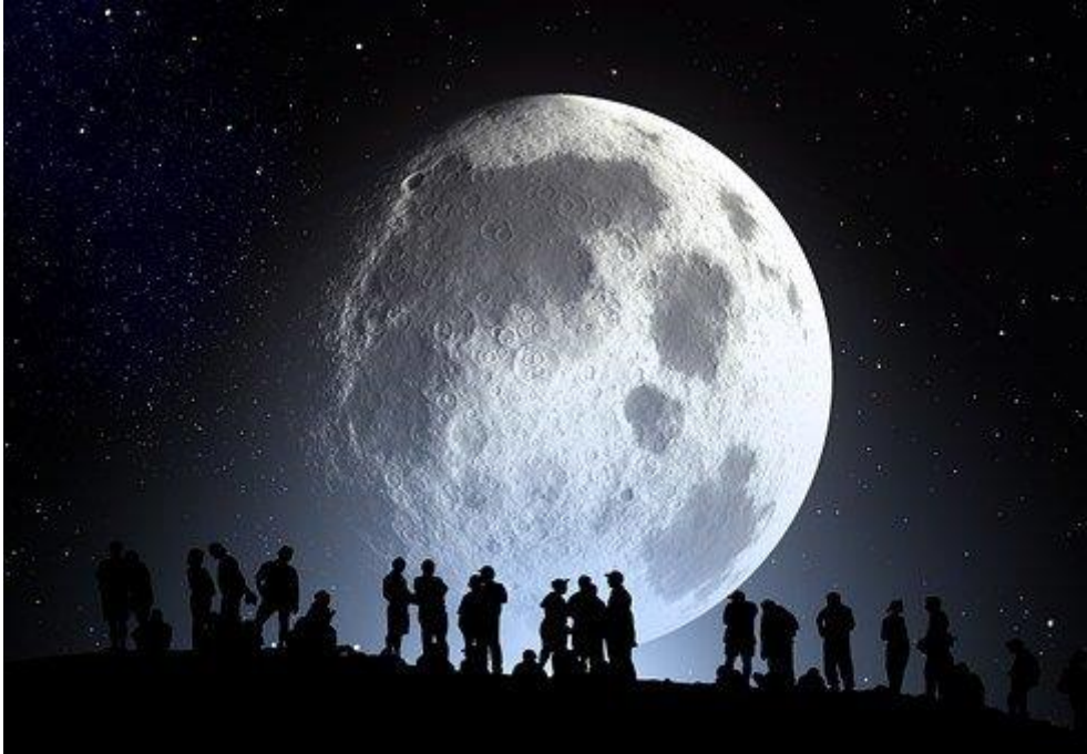
Sawirka 4aad Dayaxa.

markii qorraxda iyo dayaxa ay cirka isku doc joogaan dayaxu waa wada mugdi. Waxaana u sabab ah inaan arki karin dhanka dayaxa ay qorraxda iftiinkeeda ku hayso. Markii dayaxa u ekaado qaanso afafka u dhuuban oo dhexda u weyn, waxaa la yiraahda bil, oo waa bil cusubo dhalatay. Bil-cusubna waxaa looga jeedaa ifaaliskeeda ayaa aaya raayar usoo kordhaaya.