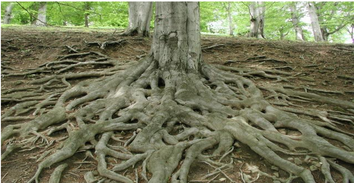
Sawirka labaad.