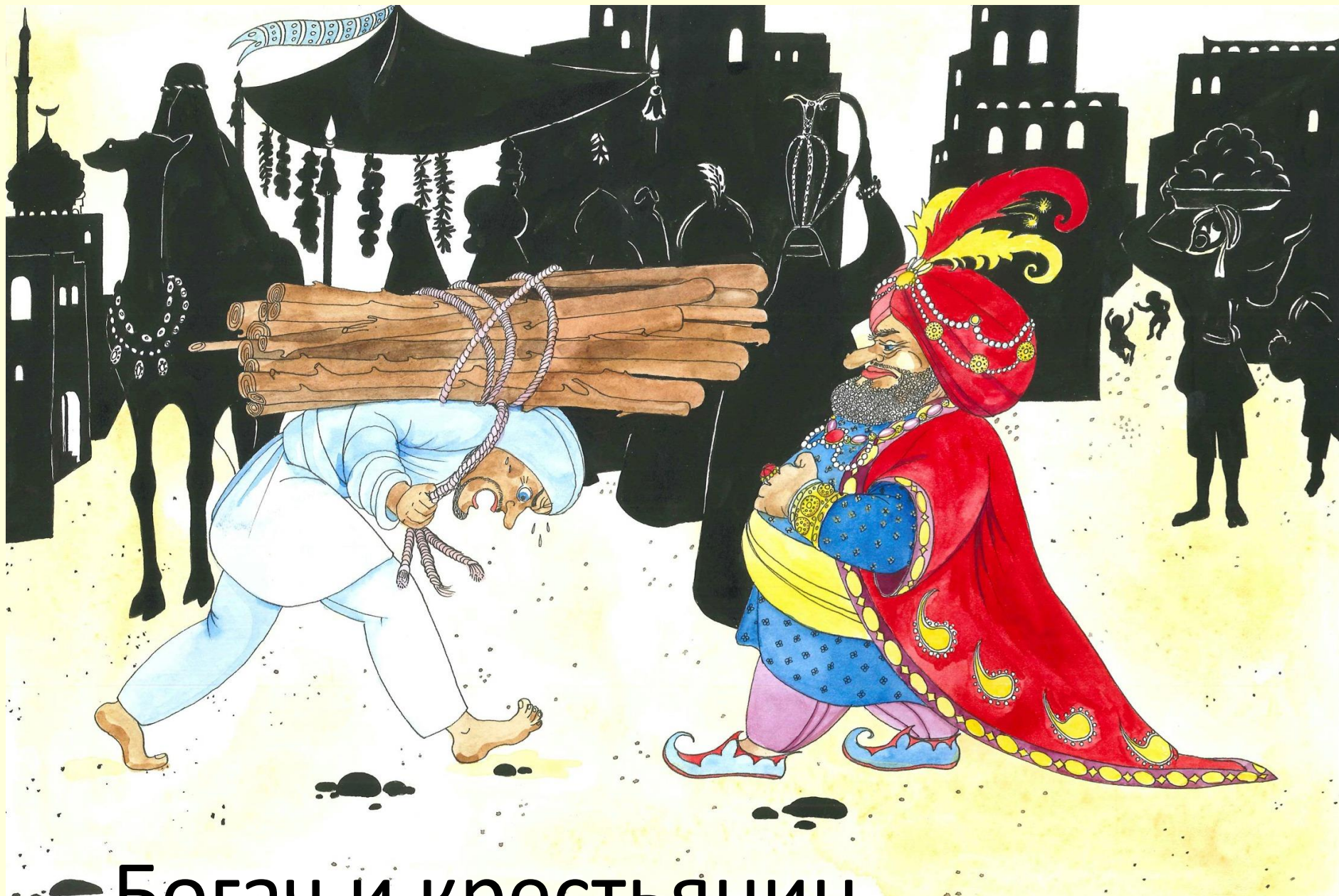
Богач и крестьянин – марокканская сказка