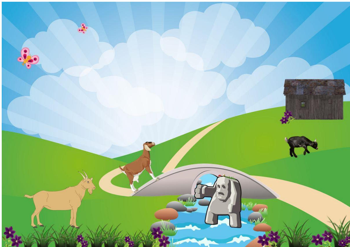
Illustrasjon: Pixabay og NAFO

Mmm, ślinka napłynęła do ust Trollowi. Dobrze! - powiedział. No to idźże prędko stąd! A ja zaczekam sobie na niego.