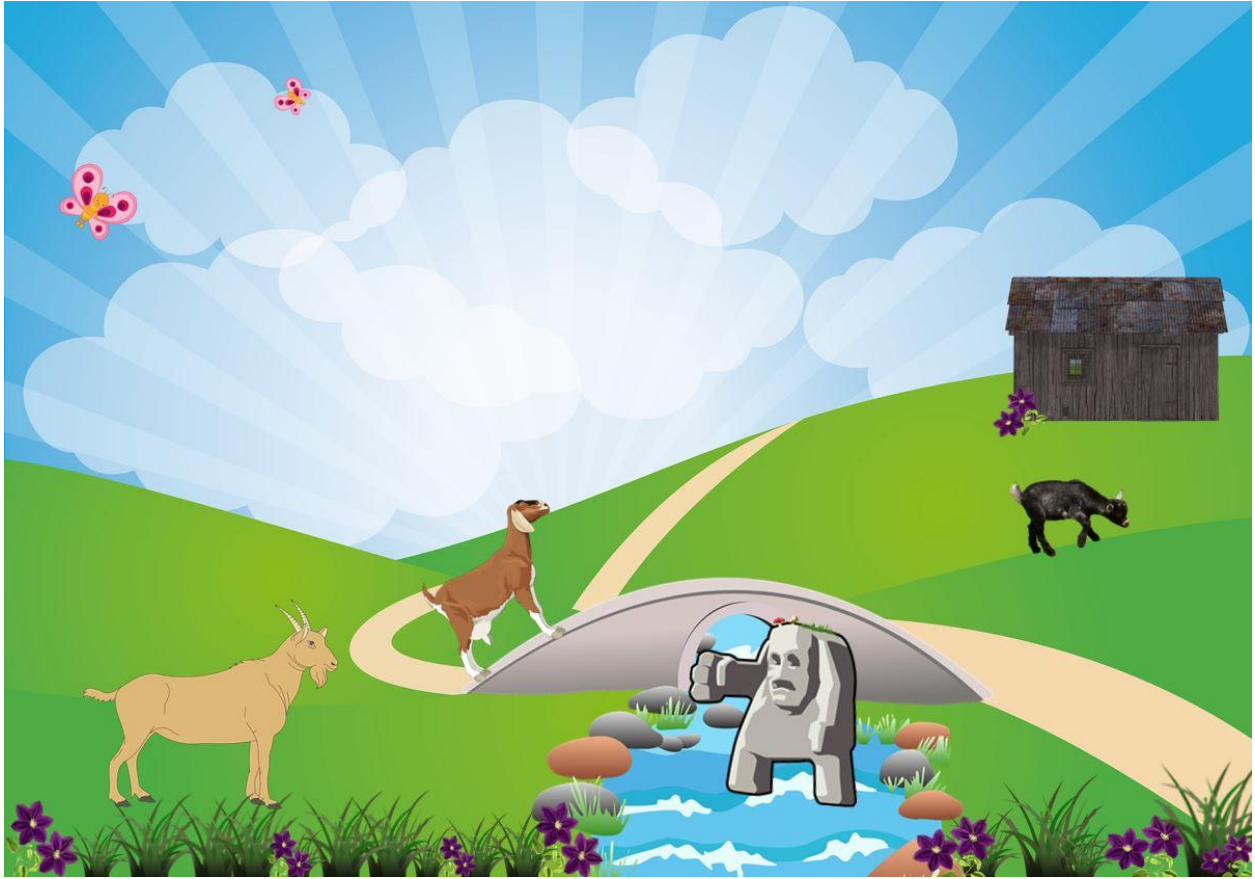
Illustrasjon: Pixabay og NAFO