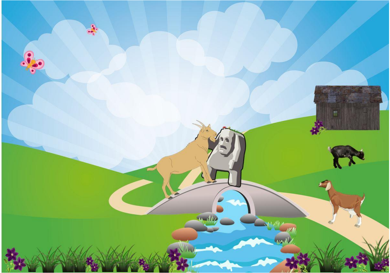
Illustrasjon: Pixabay og NAFO

Markaasuu orgigii intuu ku booday cirfiidkii oo geesihii dhaadheeraa indhaha kaga soo saaray, oo dhuuxa iyo lafahaba jabiyeey markaasuu cirfiidkii ku dhacay biyo dhacii. Orgigii orgidii kale ayuu utagay oo ladaaqay si uu u naaxo. Halkaa ayey orgidii kunnaxeen oo ay xataa gurigii inay tagaan kariwaayeen.