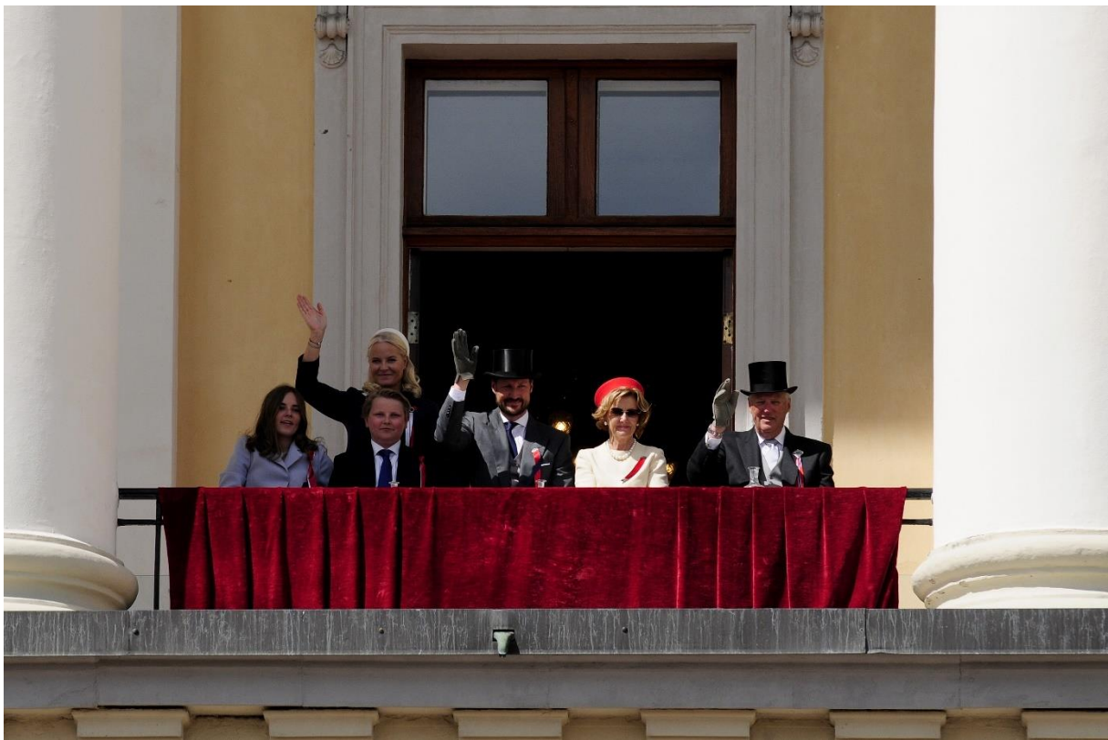
ስድራቤት ንጉስ ንሰልፊ ህጻናት ኣብ ኣስሎ ሰላም ይብሉ። ካብ ጸጋም ጻልንጉስ ኢንግሪድ ኣለክሳንድራ፣ ወዲ ንጉስ ሰቪር ማግኒስ፣ ልእልቲ መተ ማሪት፣ልኡል ሃኮን፣ ንግስቲ ሶንያን ንጉስ ሃራልድን።

ሰልፊ ህጻናት በቲ ካርል ዮሃን ድብሃል ዓቢ ጎደና ኣቢሉ ንላዕሊ ይድይብ። እቲ ሰልፊ ብቑድሚ ቤተ ንጉስ ኣቢሉ ይሓልፍ ኩሎም ህጻናትን መምህራንን ድማ ንስድራቤት ንጉስ ኢዶም ብምውዝዋዝ ሰላም ይብሉ። እቶም ስድራቤት ንጉስ ከአ መሊሶም ሰላም ይብልዎም። ኣብ ኣስሎ ኣብ ሰልፊ ህጻናት ድሳተፋ ልዕሊ ሚእቲ ቤት ትምህርታት ኣለዎ።