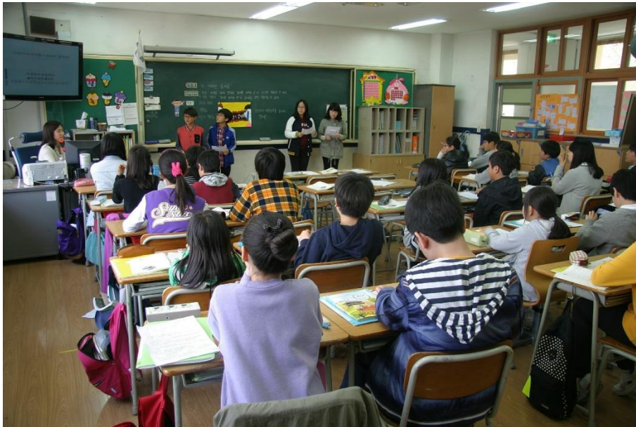
Elever i klasserom.

አብ ሓደ ክፍሊ 27 ተምሃሮ ኣለዉ። 14 ካብኦም ኣዋልድ እዮን። ኣብቲ ክፍሊ ክንደይ ኣወዳት ኣለዉ።