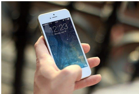
1 iPhone.

ሓደ 595 ክሮነር ዋጋ ዘለዎ ሞባይልን ሓደ 249 ክሮነር ዋጋ ዘለዎ ባትሪ መምልእን(ቻርጀር)ገዚእካ።1000 ጥቕሉል ክሮነር ኣውዲእካ ምስ ከፈልካ ክንድምንታይ ማልስ ይምለሰልካ