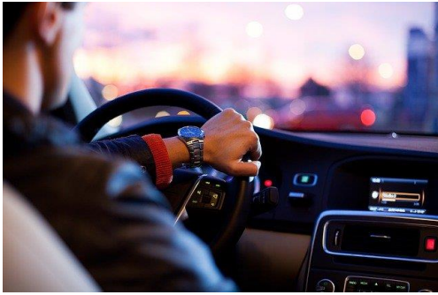
En som kjører.