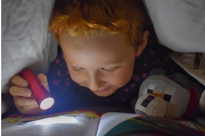
Barn som leser. Foto: Pixabay

ሃረዶች ነቲ አንን ጅርገንን ዝተባህለ 197 ገጽ ዘለዎ መጽሓፍን ካርዩስን ባክቱስን ዝተባህለ 48 ገጽ ዘለዎ መጽሓፍን ኣንቢባ። ሃረዶች ብሓባር ክንድምንታይ ገጽ ኣንቢባ