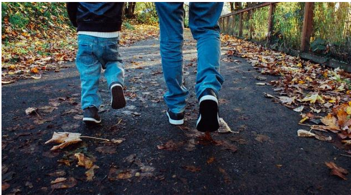
Far og sønn.