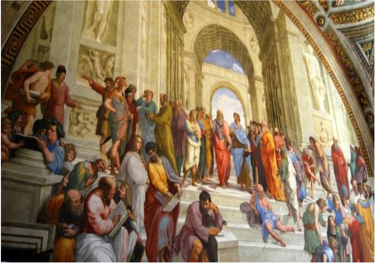
ภาพวาดโดย Rafael Santi «โรงเรียนในเอเธนส์». ซึ่งก่อตั้งโดยพลาตอน กลางภาพคือพลาตอน และอริสโตเติล