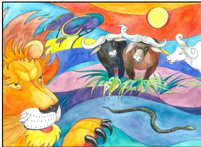
Illustrasjon: De tre oksene

Fortellinger kan bli fortalt på mange måter – de kan formidles muntlig, skriftlig, gjennom film, presenteres som tegneserier eller gjennom ulike digitale medier.