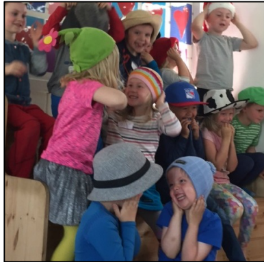
Barn leker apekatter med hatteselgerens hatter

Fortellingen om Hatteselgeren gir muligheter for å arbeide med sortering, sammenligning, former og telling. Hvor mange hatter har vi på oss? Hvordan kan vi sortere dem?