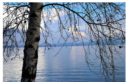
Bjørk om vinteren