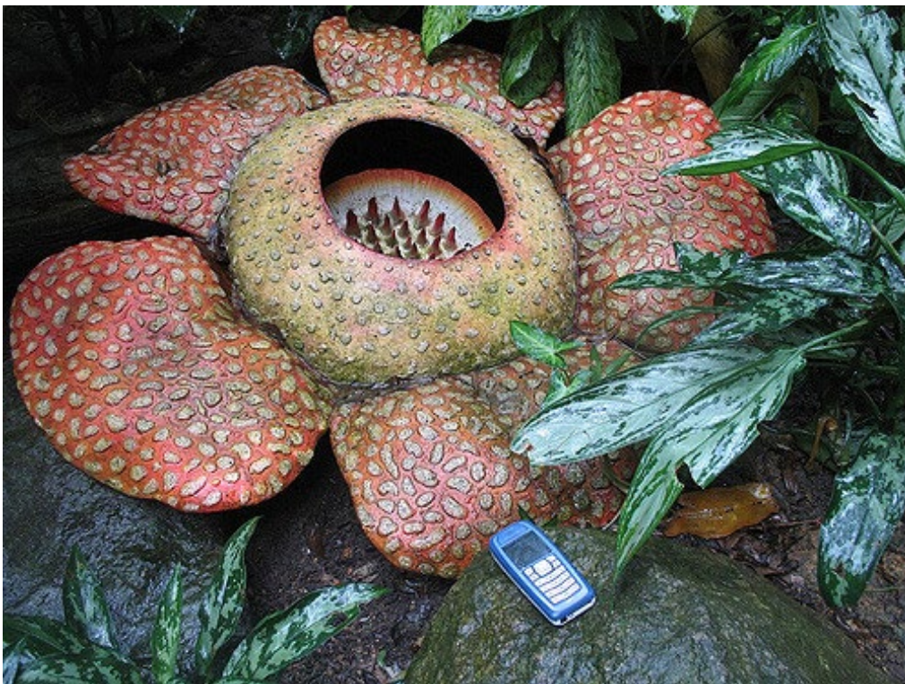
Rafflesia arnoldii

Ubaxa ugu weyn aduunka waxa la yiraa Rafflesia almodii . waxa uu dhextaalkiisu noqon karaa ilaa kabadan hal mitir. Waxa uu ka baxaa dalka Induuniisiya. Ubaxyada ugu yaryar dhexroorkoodu waa miliimitiro. Ma aragtay ubax aad u yar? Maxaa lagu yiraa magaciisa luqada noorwiiijiga am ta afkaaga hooyo?