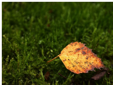
Høstløv fra bjørk