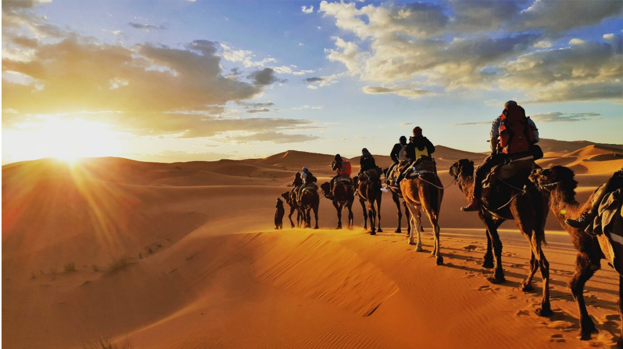
Figur 1 Фото: Сахара (Shutterstock, Gaper).

Пустыня — это большая территория с сухим климатом и большим количеством камня и песка. Сахара – самая большая пустыня на Земле.