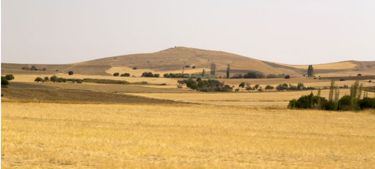
Фото: Степной ландшафт в Турции.

Степь – это открытая территория без леса. Почва во многих степях очень плодородна. Поэтому во многих странах степь используется для земледелия. Степи находятся на открытых территориях с умеренным климатом в Азии, Северной и Южной Америке.