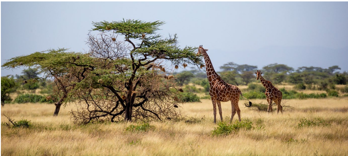
Фото: Саванна (Adobe Stock, 25ehaag6).

Саванна – это территория, поросшая высокой травой и редко растущими деревьями в тропических местностях. Большинство саванн находятся в Африке.