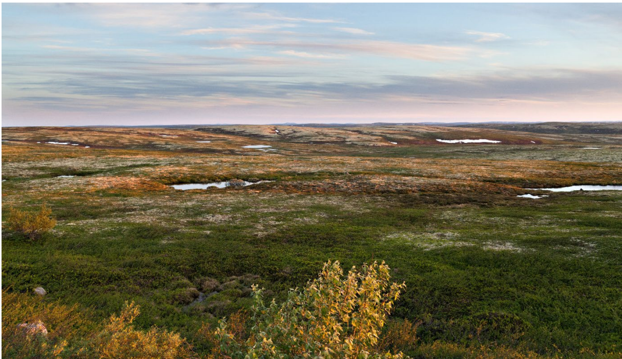
Фото: Тундра в северной России (Adobe Stock, annatronova).

Тундра – это большие территории с вечной мерзлотой. Только самый верхний слой земли оттаивает в летнее время. В тундре не растут деревья. Самые обширные участки тундры находятся в России, Канаде и на Аляске.