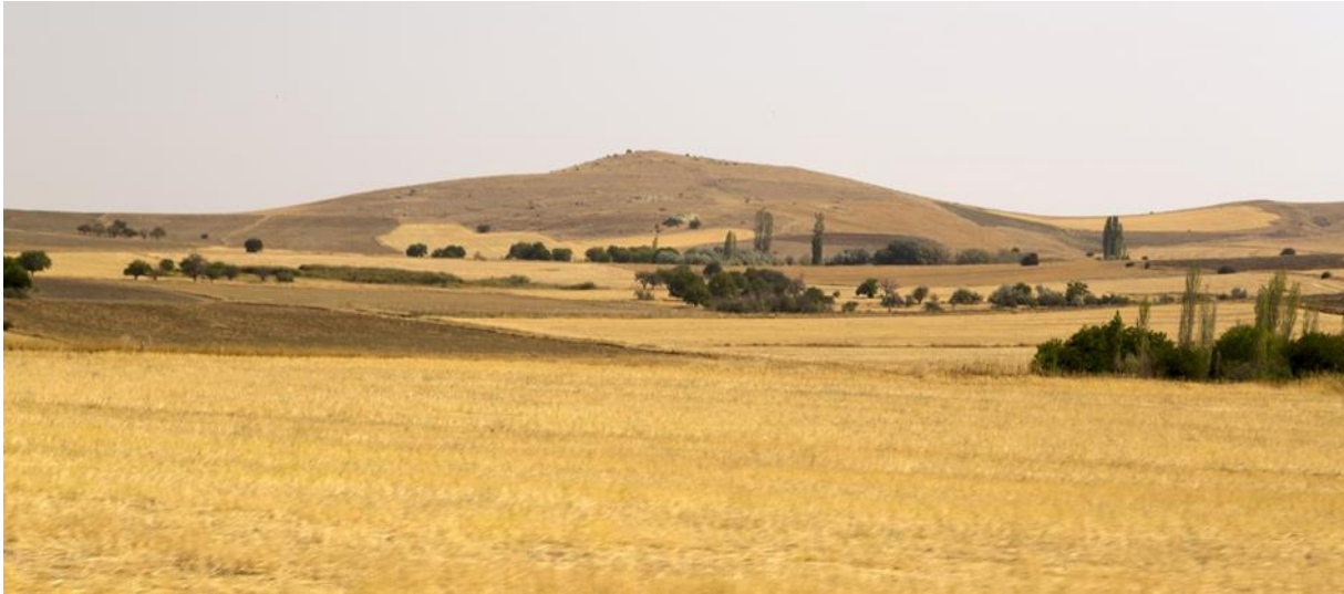
Foto: Dhul deex ah oo kuyaal Turkiga.

Deex waa aag furan oo aan kaymo lahayn. Carrada ku taal deexooyinka badan ayaa ah mid nafaqo badan. Sidaa darteed, aagag ballaaran oo dhulka deexooyinka adduunka waxaa loo isticmaalaa beeraha. Qayb dhulleedkaasna waxaa laga helaa aagagga leh cimilada dhexdhexaadka ah ee ku yaala Aasiya iyo Waqooyiga iyo Koonfurta Ameerika.