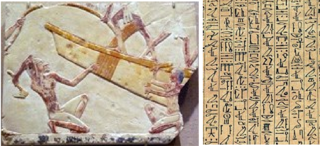
Mısırlı tekne yapımcılarını ve hiyeroglifleri gösteren sanat eseri

Mısırlılar, hiyeroglif adı verilen bir yazı sistemi geliştirdiler. Mezopotamya halkı kil tabletler üzerine yazarken, Mısırlılar papirüs üzerine yazardı.