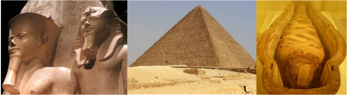
Firavunları, Cheops Piramidi'ni ve bir mumyayı gösteren resimler

Mısır'da kral güçlüydü. Büyük ve güzel bir evde, bir sarayda yaşıyordu ve asıl görevi insanların iyi olduğundan emin olmaktı. Mısırlılar onun Tanrı'nın oğlu olduğuna inanırdı ve bu nedenle ismini söylemeye cesaret edemezlerdi. Ona "büyük ev" anlamına gelen Firavun diyorlardı. Firavun olmak babadan oğula miras kalır, yerliler ise Firavuna vergi ödemek zorunda kalırdı. Bugün yaptığımız gibi parayla vergi ödemezlerdi, ancak Firavun toprağa ekilen ve yapılan her şeyden pay alırdı. Firavun barajlar, sulama kanalları ve tapınaklar inşa edip ve halkın yardım etmesi gerektiğini düşünürdü.