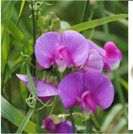
د مشنگ نبات

د مشنگ نبات پوازی يو کال عمر کوی. مشنگ يو مشيمه يی نبات دی چې تخمه يي په پسرلی کې وده کوی. دا گل په اوړي کې تخمونه جوړوي. کله چې تخمونه يي په مني کې پخيري نو نبات يي له منځه ځی. بل پسرلی تخمونه يي شنه کپړی او نوي نباتات جوړوي. مور مشنگ ته يو کلن نبات وايو.