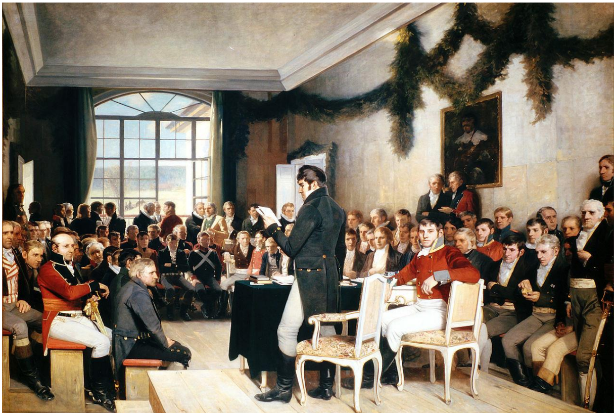
Maleriet heter Eidsvold 1814 og er malt av Oscar Wergeland. Kilde: Wikipedia

1814 m. Eidsvolyje surinko 112 aktyvistų, norinčių parašyti Norvegijos konstituciją. Jie atvyko iš skirtingų Norvegijos vietų. Ši aktyvistų grupė vadinosi Nacionaline asamblėja. Ji užtruko šešias savaites kuriant Konstituciją. Pagaliau, Gegužės 17 d. buvo baigta rašyti konstitucija, kurią pasirašė karalius Christianas Frederikas. Todėl ši diena vadinama Norvegijos nacionaline diena.