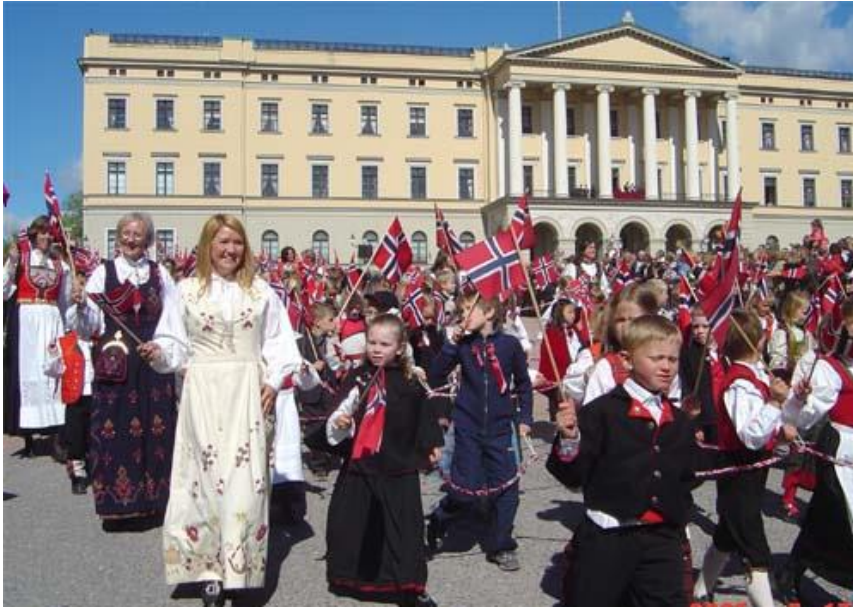
Barnetoget i Oslo foran slottet. Kan du se kongefamilien på balkongen?