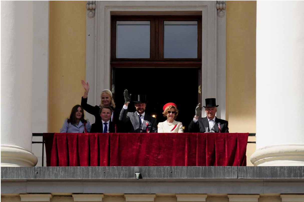
Kongefamilien vinker til barnetoget i Oslo. Fra venstre: prinsesse Ingrid Alexandra, prins Sverre Magnus, kronprinsesse Mette Marit, kronprins Haakon, dronning Sonja og kong Harald

sveikina karališkąją šeimą, o karališkoji šeima, savo ruožtu, mojuoja ir sveikina eitynių dalyvius. Oslo vaikų parade dalyvauja daugiau nei šimtas mokyklų.