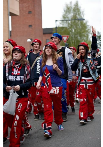
Blåruss og rødruss

Gegužės 17 diena dar vadinama vaikų diena. Visoje šalyje moksleiviai eina į paradą, mojuoja vėliavomis, šaukia “Valio” ir dainuoja. Groja orkestrai. Tą dieną daugelis žmonių gieda valstybinį himną «Ja, vi elsker». Nacionalinio himno tekstą 1859 m. parašė žinomas poetas Bjørnstærn Bjørnson, o 1863 m. jo pusbrolis Rikardas Nordraakas sukūrė nacionalinio himno melodiją.