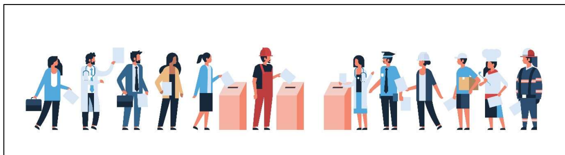
Ilustración: Adobe Stock Mst3r.

Democracia es una palabra compuesta por dos palabras griegas «demos», que significa pueblo, y «kratein», que significa soberano o gobierno. La idea de un gobierno del pueblo surgió en Atenas hace aproximadamente 2500 años. En Noruega, tenemos diferentes partidos políticos que tienen diferentes opiniones sobre cómo la sociedad debería ser. Cuando hay elecciones parlamentarias, todos los ciudadanos noruegos mayores de 18 años pueden votar por el partido con el que estén más de acuerdo.