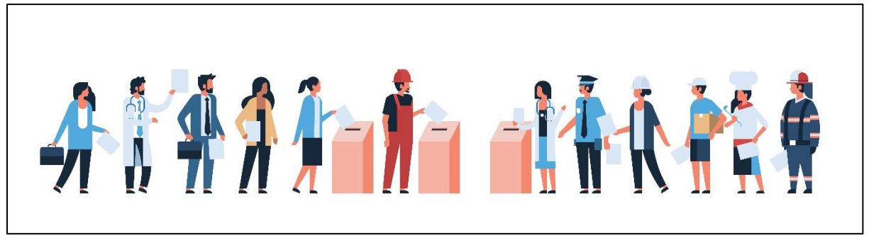
Illustrasjon: Adobe Stock Mst3r.

ዴሞክራሲ እሚለው ቃል፣ «ዴሞስና» «ክራቲን» የተባሉ ሁለት የግሪክ ቃላቶችን የያዘ የሁለት ቃላት ውህደት ነው። ዴሞስ ማለት ሕዝብ ማለት ሲሆን፣ ክራቲ ማለት ደግሞ መግዛት ወይ መምራት ማለት ነው። ሕዝባዊ መንግስት እሚለው ሃሳብ፣ የዛሬ 2500 አመት ገደማ በአቴና የተጸነሰ ሃሳብ ነው። ኖርዌይ ውስጥ፣ ሕብረተሰቡ እሚተዳደርበት ሕግ ላይ የተለያዩ አመለካከት ያላቸው የተለያዩ የፖለቲካ ፓርቲዎች አሉ። የፓርላማ ምርጫ በሚኖርበት ጊዜ፣ ሁሉም 18 አመት የሞላቸው አዋቂዎች፣ በተሻለ የሚስማማቸውን የፖለቲካ ፓርቲ መምረጥ ይችላሉ።