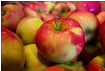
Epler. Foto: Pixabay