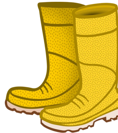
Illustrasjon av Cherrox fra pixabay.com

"شيروكس" هو حذاء طويل مطاطي له بطانة بداخله وهو بديل جيد عندما يكون الجو رطباً بشكل رهيب ودرجات الحرارة خارجاً تبدأ في الارتفاع. لكنها أحذية إصطناعية غير مريحة ولا تساعد على تهوية القدمين. وقد لا تحمي أقدام الأطفال من البرد.