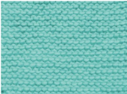
Foto av skjerf

يكون الصوف غالبا من شعر الأغنام. يوصي العديد من رياض الأطفال أن يرتدي الأطفال الصوف الرقيق في فصل الشتاء لأن طبيعة الألياف الصوفية المجوفة تحمي الجسم من البرد و تحافظ على حرارته. ولذلك يعمل الصوف كمنظم لدرجة الحرارة ويدفيء الجسم حتى لو أصبح رطبًا.