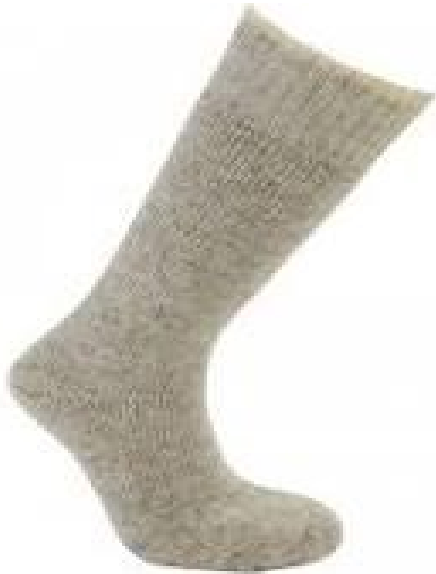
Foto av en ullsokk fra Pixabay

جوارب الصوف هي جوارب مصنوعة من الصوف. الجوارب الصوفية تحمي الجلد من البرد وتحافظ على حرارته. يقوم البعض بحياكة الجوارب الصوفية بنفسه ويشتريها البعض الآخر من المتجر.