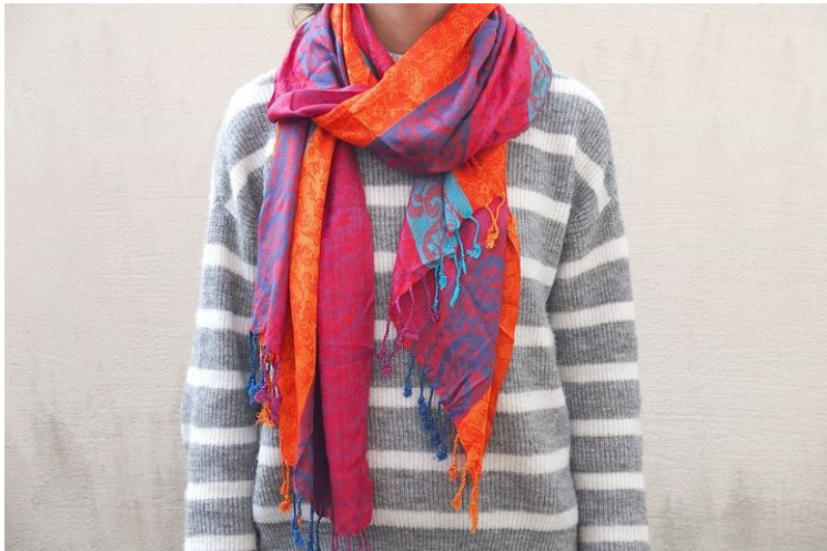
Foto av et skjerf

Dema ku seqa sar be, mirov qirika xwe bi şalgerdanê dipêçe.