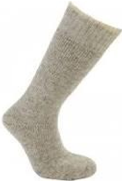
Foto av en ullsokk

Goreyên hirî cûreyek ji goreyan e ku ji hiriyê tê çêkirin. Ew çerm ji sermê diparêze û germahiyê hiltîne. Hin kes van goreyan bi destên xwe dirêsin û hin jî wan ji firoşgehan dikirin.