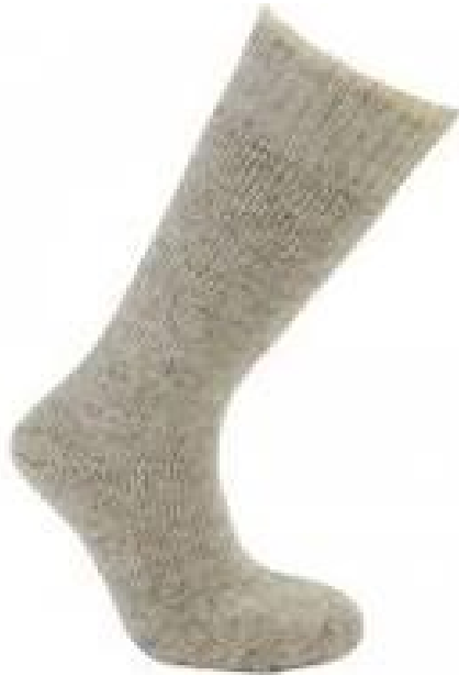
Foto av en ullsokk

Hizi ni soksi zinazotengenezwa na sufu (manyoya ya kondoo). Soksi za sufu zilizokaribu na ngozi zaidi (zinazobana) zinahifadhi joto. Watu wengine wanashona wenyewe soksi za sufu na wengine wana zinunua dukani (sokoni) soksi za sufu.