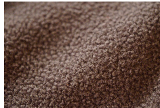
Foto av fleece

Fleece ni neno la pamoja linalo maanisha aina mbalimbali za nguo zilizo za laini na kuleta joto mwilini. Mtoto anaweza kuvaa fleece juu nguo ya sufu ama chini ya suti ya wakati wa baridi wakati kuna baridi nje.