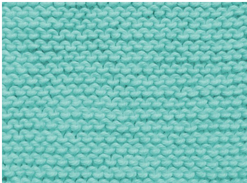
Foto av skjerf

Sufu inatokana na manyoya ya kondoo. Chekechea (shule za watoto wadogo) zinapendekeza watoto wavae nguo nyembamba za sufu wakati /msimu wa baridi, kwa sababu kila nyuzi ya sufu ina nafasi na inahifadhi joto toka mwilini na kulihifadhi. Sufu inafanya kazi kurekebisha joto na kujipa joto yenyewe hata inapokuwa na majimaji (unyevunyevu).