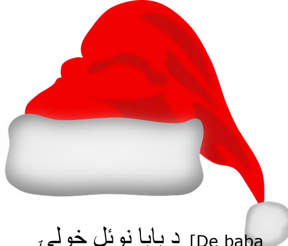
د بابا نوئل خولی [De baba nuel khwale] Nisselue