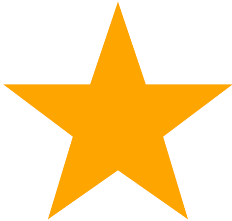
ستوری [Stori] Stjerne