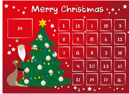
د کریسمس جنتری [De krimes jantari] Julekalender