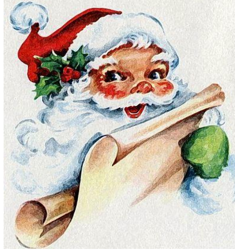
بابا نوئل [Baba nuel] Julenisse