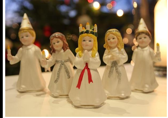
لوسيا [Lucia] Lucia