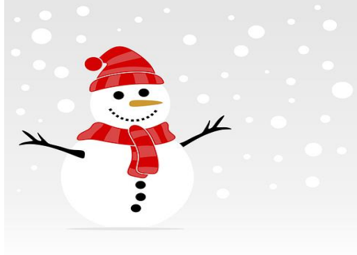
د واوري سړی [De wawre salai] Snømann