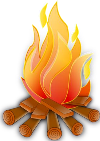
اور [Or] Bål