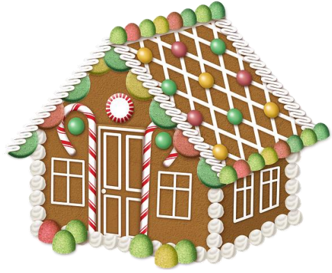
د مرچکی کیک کور [De morchake kor] pepperkakehus