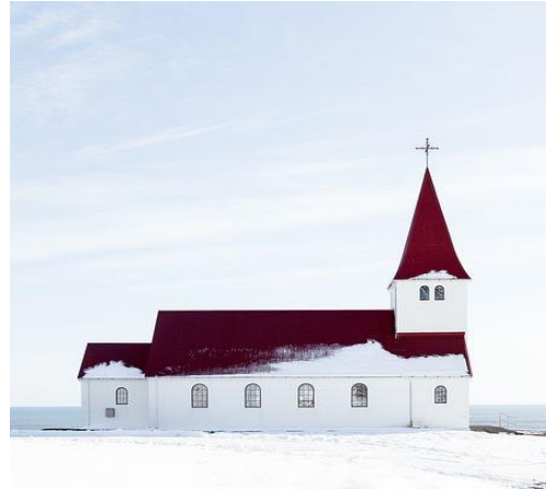
کلیسا [Kælisa] kirke