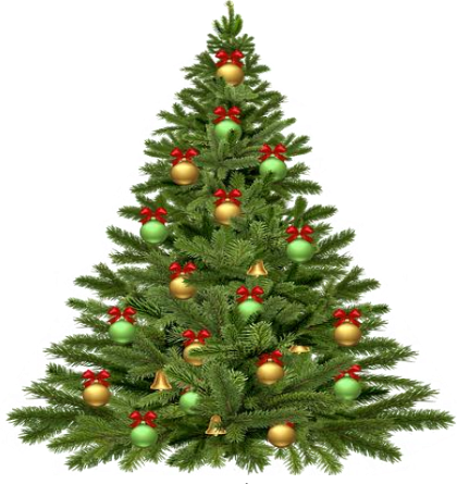
د کریسمس ونه [De krismes wonæ] Juletre