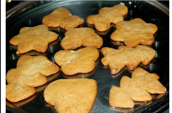
د مرچکی کیک [De morchake kek] Pepperkake