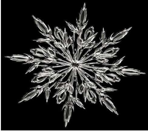
د واوري کريستال [De wawre kristal] Snøkrystall