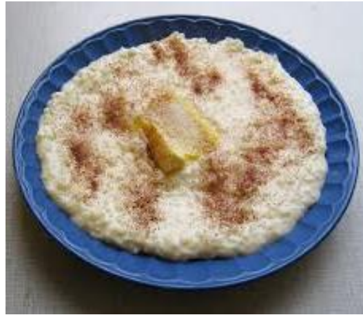
شوله [Sholæ] Grøt