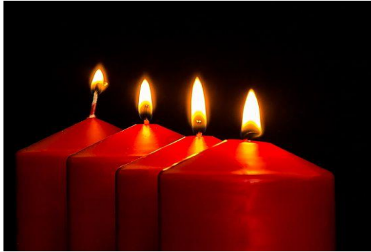
شمعی [Shame] Lys