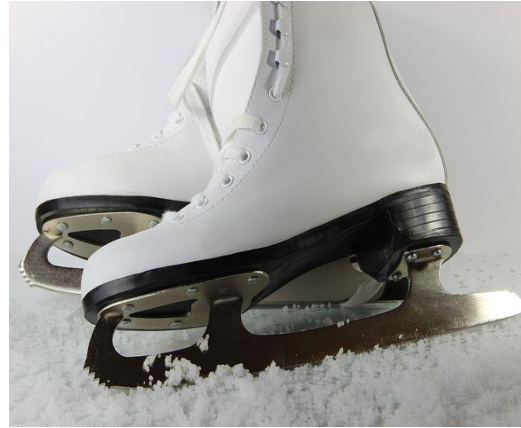
د يخ اسكيت [De yakh sket] isskøyter