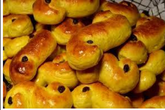
د لوسي كلچي [De luse kolche] lussekatter