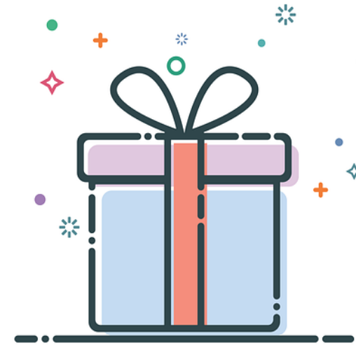
تحفه [Tohfæ] Gave