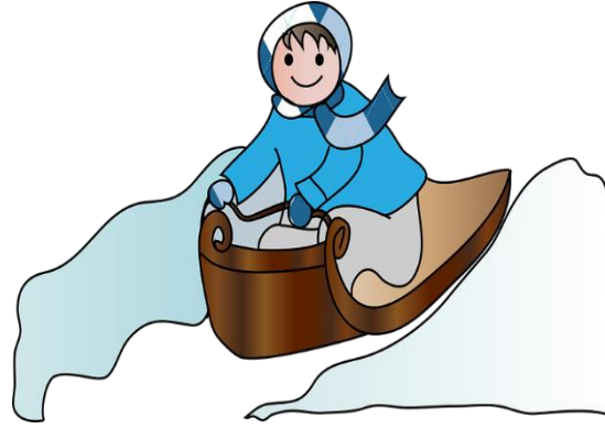
سلدس [Sleds] Akebrett