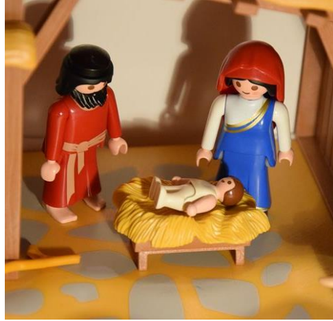
زانگو [Zango] Krybbe