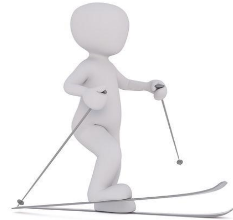
سکي [Ski] Ski