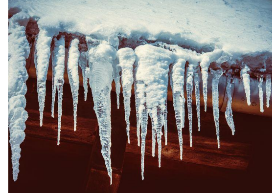
گنګوري [Gængole] Istapp