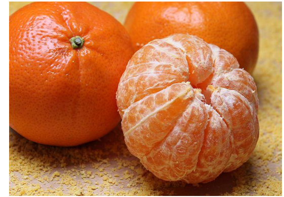
كينو [Keno] Klementiner