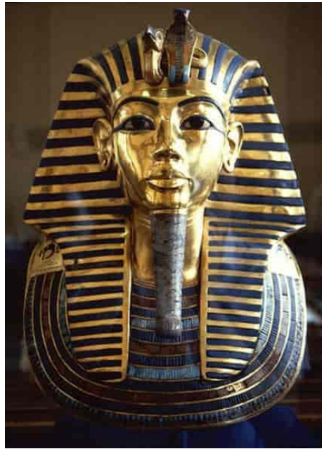
ill: Michael Reeve (CC BY SA 3.0)

در تمام این مدنیت ها، دولت سازی ها، شهرهای بزرگ، شاهان قدرتمند و تفاوت های زیاد اقتصادی و اجتماعی بوجود آمد. قدیمی ترین شاه که در میبراگیسی (عراق امروزی) قریب ۵۰۰۰ سال پیش در دولت شهر کیش زندگی می کرد. شاهان در قلمرو مصر فرعون نامیده می شدند.