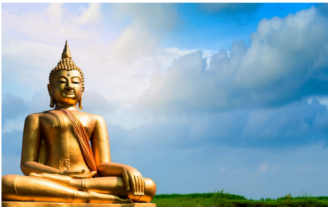
Bilde 2:

БУДДИЗМ - одна из трёх (наряду с христианством и исламом) мировых религий. Возник в Др. Индии в 6-5 вв. до н. э. Основателем считается Сиддхартха Гаутама (см. Будда). Основные направления: хинаяна и махаяна. Расцвет буддизма в Индии 5 в. до н. э. — нач. 1-го тыс. н. э.; распространился в Юго-Вост. и Центр. Азии, отчасти в Ср. Азии и Сибири, ассимилировав элементы брахманизма, даосизма и др. В Индии к 12 в. растворился в индуизме, сильно повлияв на него. Выступил против свойственного брахманизму преобладания внешних форм религиозной жизни (в т. ч. ритуализма). В центре буддизма — учение о «4 благородных истинах»: существуют страдание, его причина, состояние освобождения и путь к нему. Страдание и освобождение — субъективные состояния и одновременно некая космическая реальность: страдание — состояние беспокойства, напряжённости, эквивалентное желанию, и одновременно пульсация дхарм; освобождение (нирвана) — состояние несвязанности личности с внешним миром и одновременно прекращение волнения дхарм. Буддизм отрицает потусторонность освобождения; в буддизме нет души как неизменной субстанции — человеческое «я» отождествляется с совокупным функционированием определённого набора дхарм, нет противопоставления субъекта и объекта, духа и материи, нет бога как творца и, безусловно, высшего существа. В ходе развития буддизма в нем постепенно сложились культ Будды и бодхисатв, ритуал, появились сангхи (монашеские общины) и т. д.