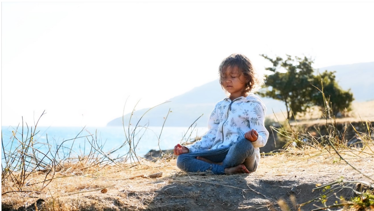
Bilde 1: Barn som mediterer

Буддизм является в настоящее время одной из основных и самых распространённых мировых религий. Приверженцы этой религии населяют преимущественно регионы Центральной, Южной и Юго-Восточной Азии. Однако сфера влияния Буддизма выходит за пределы указанного района земного шара: его последователи имеются и на других континентах, хотя и в меньшем количестве. Велико число буддистов и в нашей стране, в основном в Бурятии, Калмыкии и Туве. Буддизм — самый древний из трёх мировых религий. Он "старше" христианства на пять веков, а ислам "моложе" его на целых двенадцать столетий. В общественной жизни, культуре, искусстве многих азиатских стран буддизм сыграл роль не меньшую, чем христианство в странах Европы и Америки.