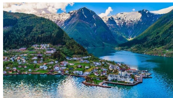
Balestrand ligger ved Sognefjorden

نام استان‌های نروژ غربی (Vestlandet) موره و رومسدال (Møre og Romsdal)، ویستلاند (Vestland) و روگلاند (Rogaland) است. نروژ غربی به خاطر آب‌دره‌های طولانی و کوه‌های مرتفع خود شهرت جهانی دارد. طولانی‌ترین آب‌دره‌ی نروژ سوگن‌فیوردن (Sognefjorden) است که نروژ غربی قرار دارد. طول آن ۲۰۴ کیلومتر است.