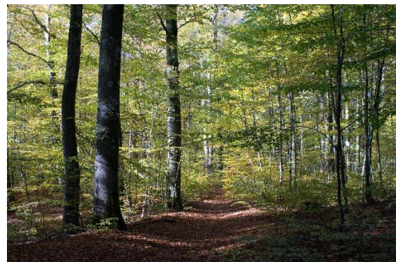
Bøkeskogen i Larvik

فاریسوانت (Farrisvannet) در استان وستفولد و تیلیمارک واقع شده است. آب معدنی فاریس (Farris) نام خود را از فاریسوانت گرفته است. اما آب معدنی فاریس از فاریسوانت (Farrisvannet) نیست، بلکه از چشمه‌های کف جنگل که در نزدیکی برکه‌سکوگن (Bøkeskogen) قرار دارد، گرفته می‌شود.