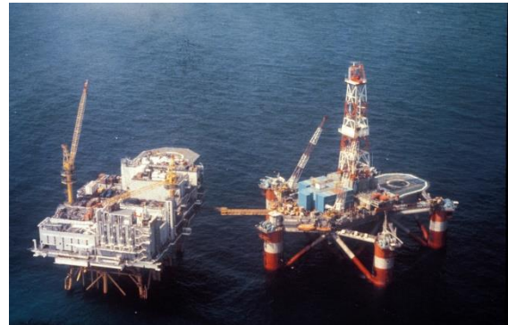
Oljeplattform