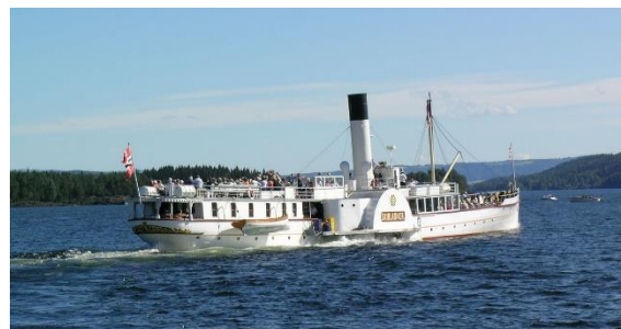
Skibladner er et dampskip.

اینلانه یگانه استانی است که خط ساحلی ندارد. این استان با سوئد هم مرز است. میوسا (Mjøsa) بزرگ‌ترین دریاچه نروژ است. میوسا (Mjøsa) در استان اینلانه واقع شده است. میوسا را به خاطر شیبلاذر (Skibladner) شهرت دارد. شیبلاذر (Skibladner) قدیمی‌ترین کشتی نروژ بوده که فعال است. شیبلاذر بین ایدسول (Eidsvoll)، هامار (Hamar)، لیلهامار (Lillehammer) و یوویک (Gjøvik) حرکت می‌کند.