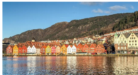
Bryggen i Bergen

برگن (Bergen) بزرگ‌ترین شهر وستلاند است. برگن دومین شهر بزرگ نروژ است و این شهر را اکثراً پایتخت نروژ غربی می‌نامند. بریگن (Bryggen) یک مکان مشهور در برگن است.