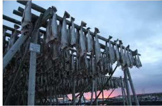
ماهی کاد (Skrei) بالای قفسه برای خشکاندن.

لوفوتن (Lofoten) در نوردلند واقع گردیده و از جزایر زیادی تشکیل شده است. از ژانویه تا آوریل، ماهیگیری لوفوت (Ilofotfisket) در لوفوتن انجام می‌شود. در جریان ماهیگیری لوفوت، مقدار زیادی ماهی سکرای (Skrei) گرفته می‌شود. سکرای (Skrei) یک نوع ماهی کاد است که نقطه دوردست شمال در دریای بارنتس (Barentshavet) زندگی می‌کند. از ژانویه تا آوریل، ماهی کاد شمالی (Skrei) برای تخم‌گذاری به لوفوتن (Lofoten) شنا می‌کند. قسمت زیاد ماهی کاد خشکانده می‌شود. ماهیان خشک شده را ماهی خشک می‌گویند. بیش‌تر ماهی خشک به کشورهای دیگر مانند ایتالیا و نیجریه صادر می‌شود.