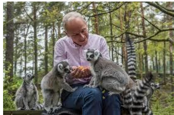
Lemurer i Kristiansand dyrepark.

کریستیانساند (Kristiansand) بزرگ‌ترین شهر جنوب نروژ یا سُرلانِه ( ) است. بزرگ‌تری باغ‌وحش نروژ در کریستیانساند واقع شده است که نام آن باغ‌وحش کریستیانساند است، ولی مردم معمولاً آن را به نام باغ‌وحش (Dyreparken) یاد می‌کنند.