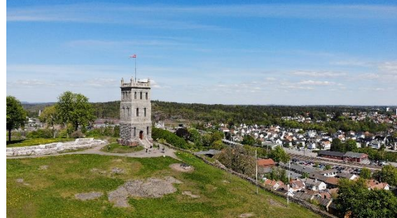
Slottsfjellet i Tønsberg

تنسبرگ (Tønsberg) در ویستفولد و تیلیمارک واقع شده و قدیمی‌ترین شهر نروژ است. این شهر در حدود سال ۸۷۰ میلادی تأسیس شده است. شلوتس فیله (Slottsfjellet) در تنسبرگ (Tønsberg) واقع شده و بزرگ‌ترین شهر ویران شده شمال اروپا است.