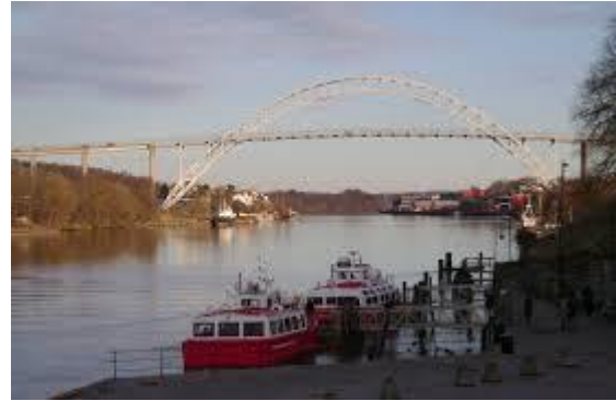
Glomma har sitt utløp i Fredrikstad.

بلندترین کوه‌های نروژ در شرق نروژ قرار دارند. گلاوپیگن (Galdhøpiggen) بلندترین کوه نروژ است. این کوه ۲۴۶۹ متر ارتفاع دارد. به این معنی که نوک گلوپیگن (Galdhøpiggen) ۲۴۶۹ متر از سطح دریا ارتفاع دارد.