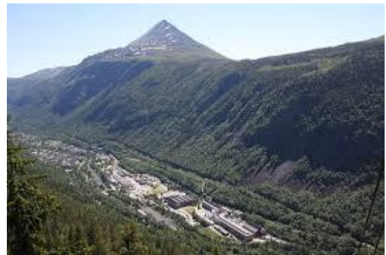
Gaustadtoppen. Nede i dalen ser vi Rjukan by.

استان‌های ویستفولد و تیلیمارک (Vestfold og Telemark) از ساحل و تا کوه‌های مرتفع گسترش یافته است. گوستادتاپن (Gaustadtoppen) بلندترین کوه ویستفولد و تیلیمارک است. گوستادتاپن در روکان (Rjukan) واقع شده و از سطح دریا ۱۸۸۳ متر ارتفاع دارد.