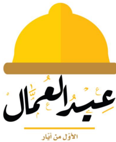
Першотравневий плакат арабською.