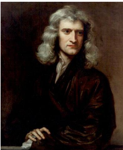
Isac Newton