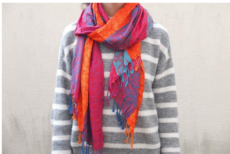
Foto av et skjerf fra Pixabay

Skjerf er et klesplagg man har rundt halsen når det er kaldt ute.