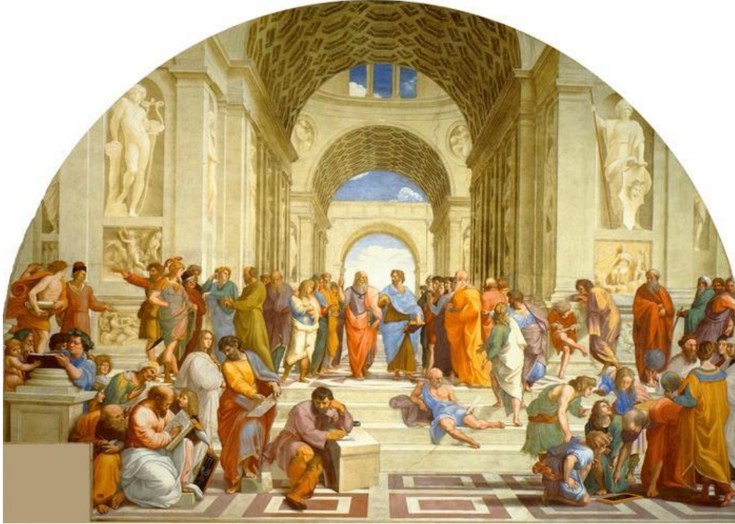
Школа в Афинах (Арістотель у блакитному). Рафаель, 1510 р./Ватиканський палац. CC BY SA 3.0

За часів Платона більшість людей вважали, що існує різниця між душами вільних людей та рабів, а також між чоловіками та жінками. Вони вважали, що душа чоловіка більш розвинена, ніж душа жінки, і що раби мають менш розвинену душу, ніж вільні люди. Платон не погоджувався з тим, що між душами різних людей існують відмінності. Він вважав, що до всіх потрібно ставитися однаково.